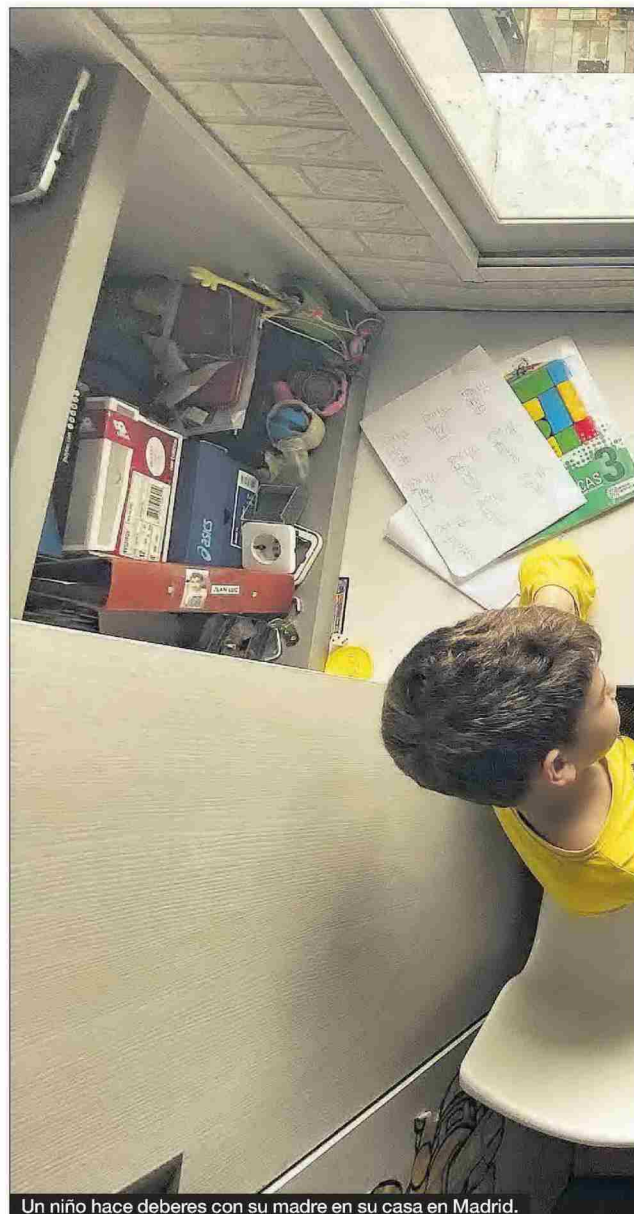
Un niño hace deberes con su madre en su casa en Madrid.

Más clara está la próxima selectividad, que como ya se anunció se llevará a cabo los primeros días del mes de julio. Como los estudiantes que se van a presentar a las pruebas de acceso a la universidad este año no habrán cursado el tercer trimestre de las asignaturas, «ya se acordó hace unas semanas con las universidades que el contenido de las pruebas será más flexible», indicó Celaá.