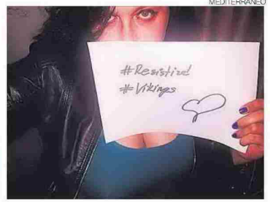
► Vibrantes y solemnes vídeos de Belle de Z.