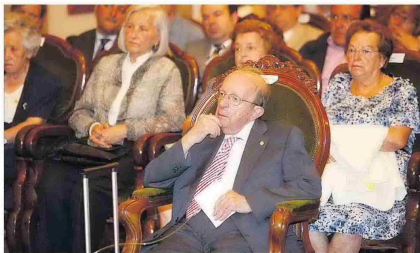
►► En el salón de plenos del consistorio, en el año 2014, cuando fue nombrado hijo predilecto de Castelló.