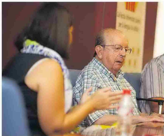
►► Durante un reciente homenaje en la Universitat Jaume I.