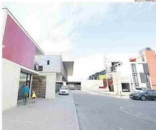
▶ El Centro de Tecnificación Deportiva fue inaugurado hace casi 10 años.