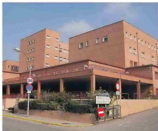
▶ Imagen del complejo de Penyeta Roja situado en en Castellón.

«Ojalá no fuera necesario, pero hemos de prevenir todos los escenarios, incluidos los más negativos», afirmó Puig, a la vez que subrayó que en los próximos días se puedan duplicar las UCI disponibles para garantizar la atención en caso de un escenario de «peor evolución de la enfermedad». Así-