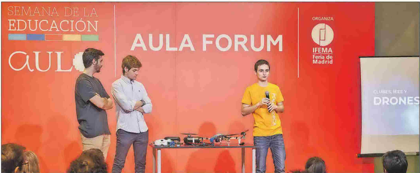
Presentación de AULA Forum en la edición del 2019.

La Universidad Pontificia de Salamanca arranca la semana con dos actividades en su stand, relacionadas con dos de sus facultades. Se trata de un recorrido virtual por las instalaciones de la facultad de Informática, y un estudio fotográfico de la Facultad de Comunicación. El Centro Universitario Cardenal Cisneros ha desarrollado una herramienta cuyo objetivo es buscar talento entre los jóvenes que deseen formarse para ser maestros. Por su parte, la Saint Louis University-Madrid Campus va a mostrar a los visitantes cómo utiliza el Sistema Académico Americano como método de aprendizaje, un modelo que se utilizó en el Espacio Europeo de Educación Superior (Plan Bolonia). Por último, la Escuela Internacional de Protocolo va a presentar el convenio de colaboración con la Universidad de Northampton, mediante el cual los alumnos que superen con éxito su Titulación pueden acceder al último año de esta reconocida universidad inglesa.