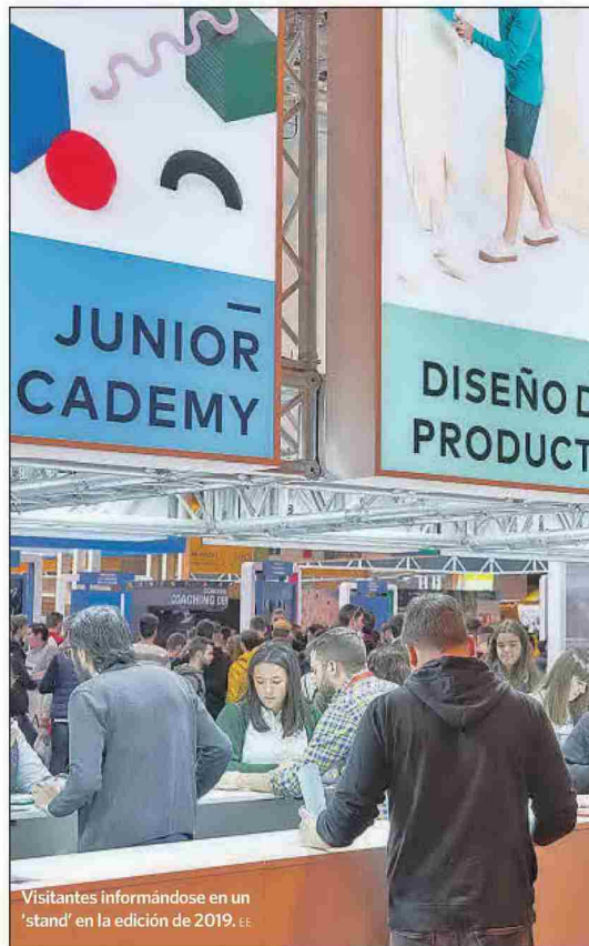
Visitantes informándose en un 'stand' en la edición de 2019. EE

La Universidad de Alcalá (UAH) ofrece las últimas propuestas de sus tres campus. Además, el centro presenta estudios de grado, posgrado