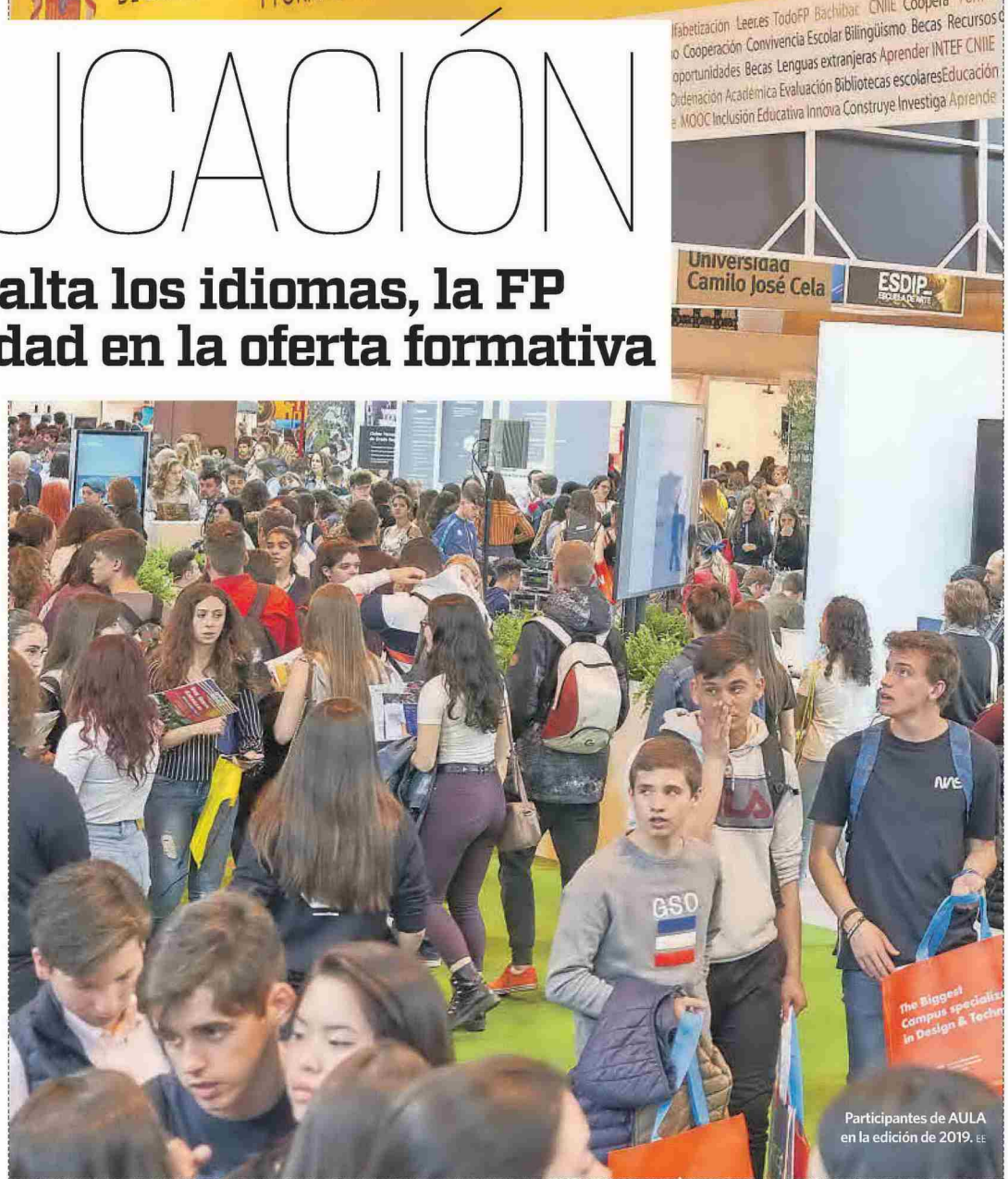
Participantes de AULA en la edición de 2019. €€

Este año cuenta con una amplia presencia de centros universitarios nacionales e internacionales privados. Entre ellos se encuentra la Universidad CEU San Pablo, cuya oferta está caracterizada por una clara apuesta por la innovación tecnológica, la calidad, la internacionalización y su proximidad a la empresa. La Universidad Francisco de Vitoria muestra sus últimas novedades, entre ellas sus Grados en Ingeniería de la Industria Conectada 4.0, en Administración y Gestión de la Industria de la Moda, y en Ingeniería Biomédica. Entre las propuestas de la Universidad Pontificia de Comillas, se encuentra el doble grado en Análisis de Negocios y el Máster Universitario en Ingeniería Industrial.