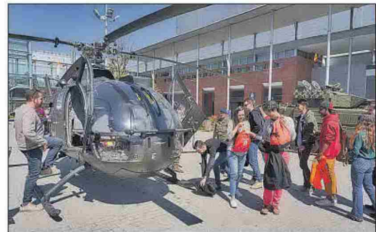
Presentación de las Fuerzas Armadas en la edición de 2019. EE

Todos los participantes y, en especial, las universidades cuentan este año con un amplio programa de