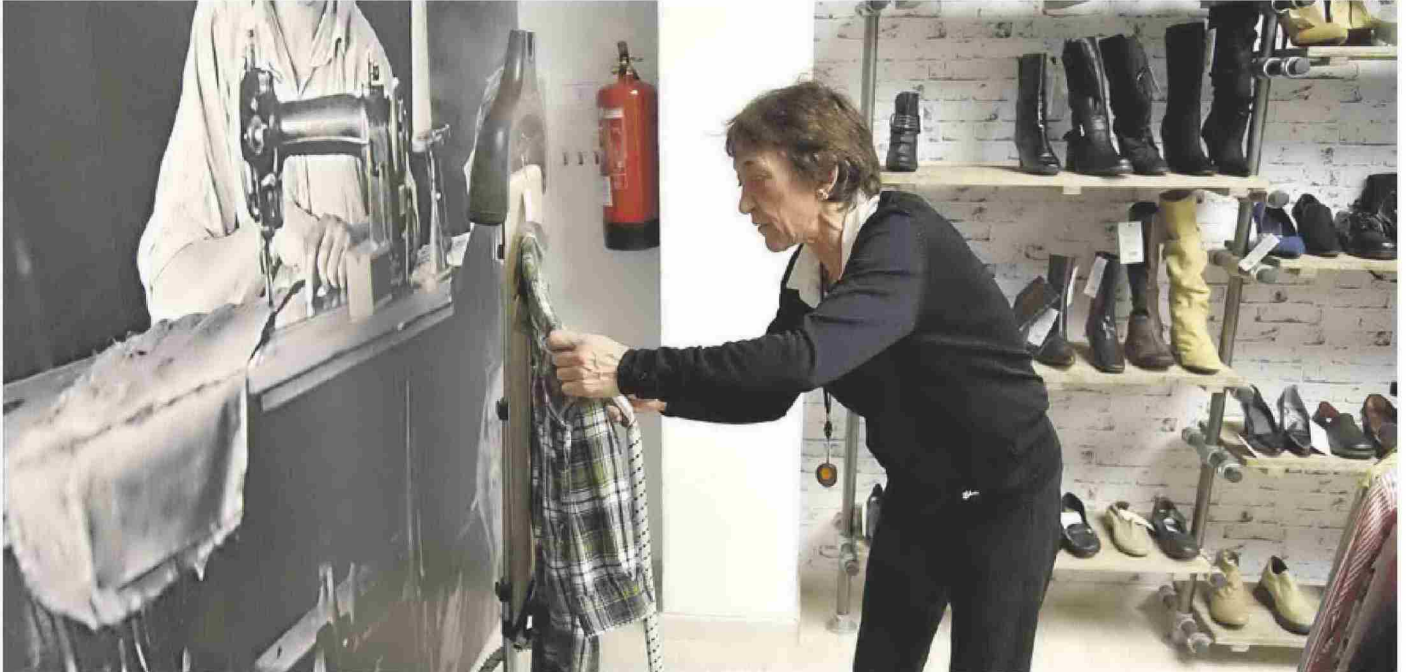
►► A medida que crece la edad se incrementan también las dificultades para reincorporarse al mercado laboral, una situación que se intensifica en el caso del colectivo femenino.

El envejecimiento de la población y la salida de las féminas del hogar son dos de las causas