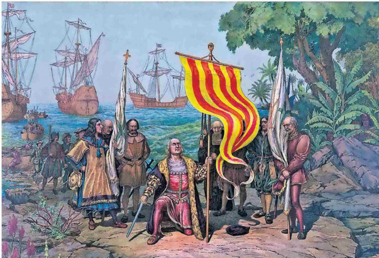
Fotomuntatge a partir d'un dibuix que simbolitza el descobriment d'Amèrica per Cristòfor Colom, a qui s'ha volgut fer passar com a mariner català.