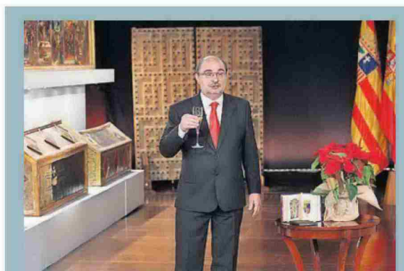
El president d'Aragó, Javier Lambán, brindant a Sixena el 2017.