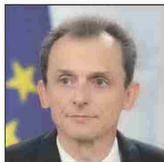
Pedro Duque. NACHO MARTÍN

El presidente del Gobierno en funciones, Pedro Sánchez, ha señalado su intención de que algunos de los principales ministros repitan en sus carteras. Es el caso del astronauta Pedro Duque, ministro de Ciencia, Innovación y Universidades en funciones. Ayer, durante la presentación del informe de la CRUE, aseguró que está "dispuesto" a repetir en el cargo en la próxima legislatura. "Lo he dicho siempre, estoy dispuesto a seguir trabajando por el sistema de conocimiento e innovación". Según Duque, que repita como ministro "dependerá de España". "De si necesita que trabaje yo o tienen otra idea", añadió ayer. Cabe destacar que el que viajó por el espacio fue uno de los más valorados por los ciudadanos y el único de los 17 ministros que aprobó, con 5,41 puntos, según el barómetro del Centro de Investigaciones Sociológicas.