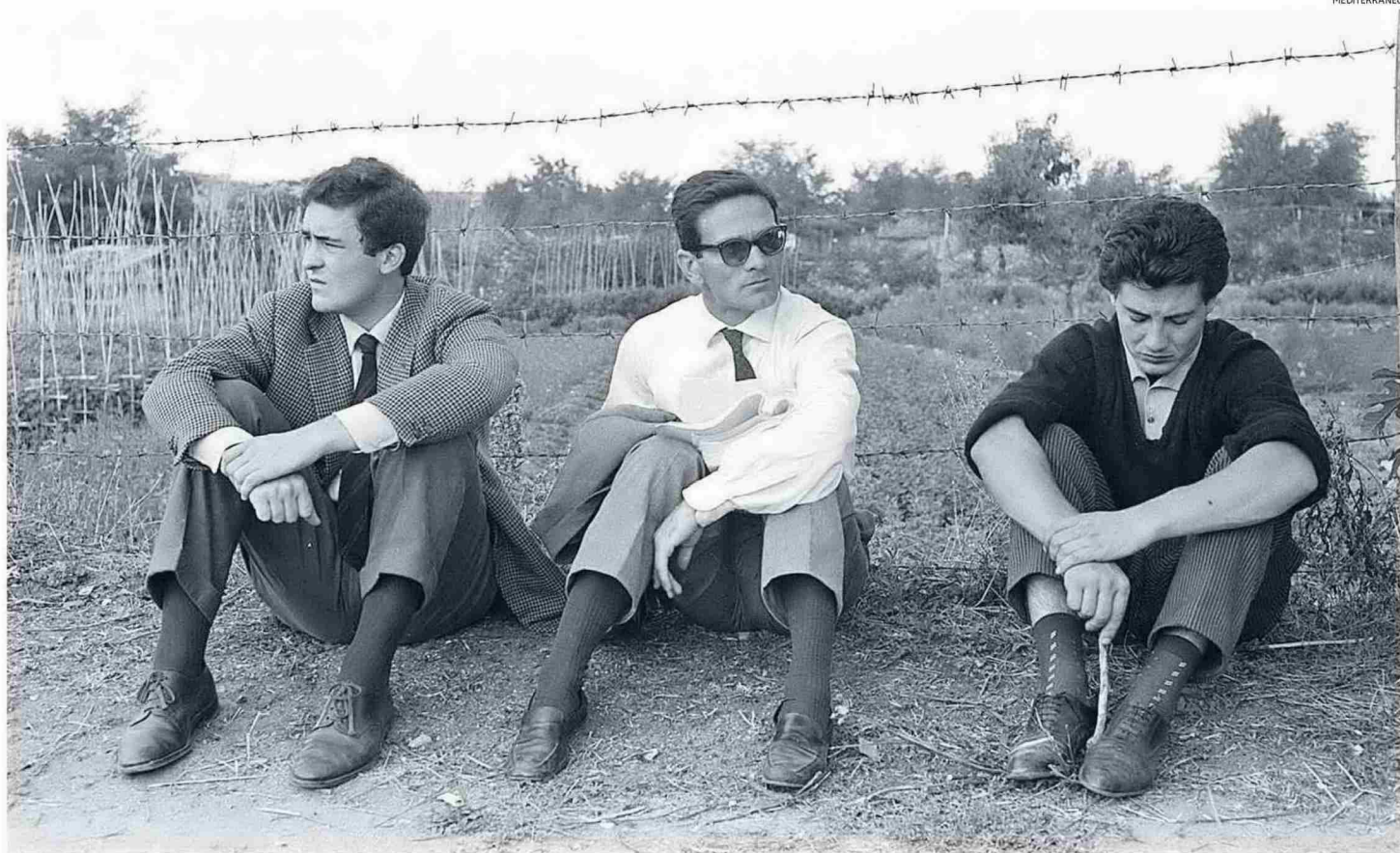
Amistat. Un jove Bernardo Bertolucci al costat d'un també jove Pier Paolo Pasolini. Tots dos van col·laborar en els inicis de la seua carrera com ho demostra la primera etapa de Bertolucci.