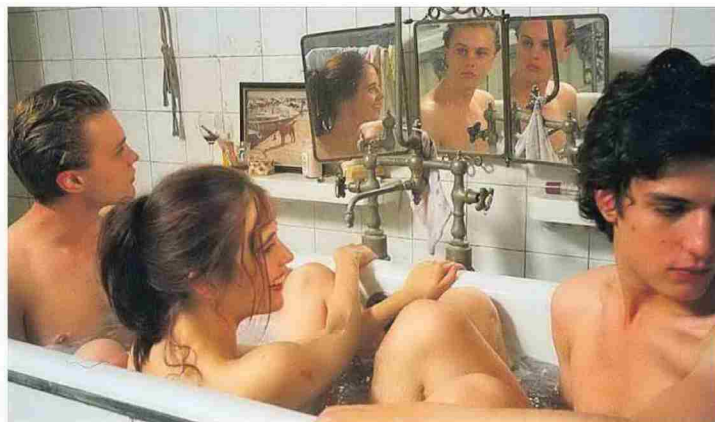
'Somiadors'. Aquest film serà l'encarregat de tancar el cicle que organitza el Paranimf.

es projectaran en el Paranimf de la Universitat Jaume I gràcies al cicle En pantalla gran que en aquest inici de temporada dediquen al director italià. Si l'any passat vam poder gaudir amb la filmografia d'Ingmar Bergman amb motiu del centenari del seu naixement, en aquesta edició des del Servei d'Activitats Socio-culturals de l'UJI han volgut rendir el seu particular homenatge a Bertolucci quan es compleix un any de la seua defunció.