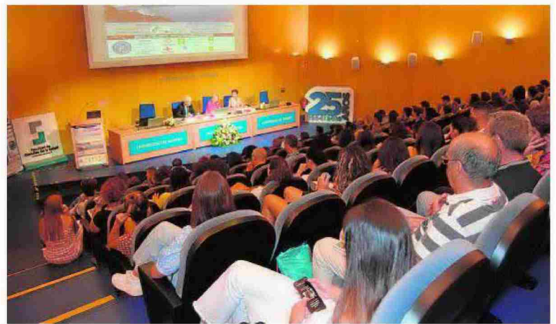
Asistentes al acto inaugural de las VI Jornadas Internacionales de Graduados en Ciencias de la Salud.