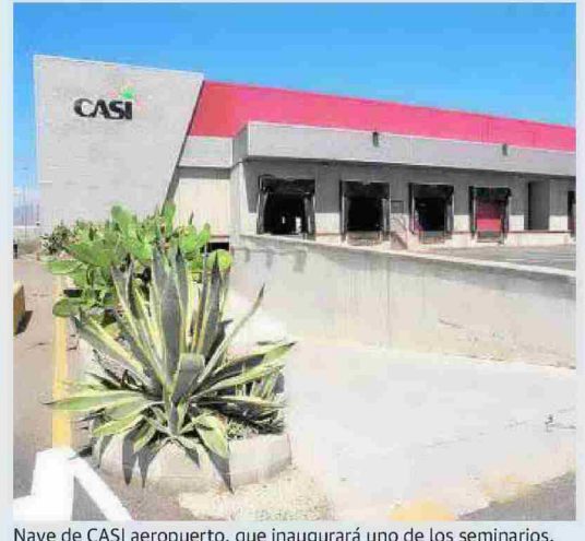
Nave de CASI aeropuerto, que inaugurará uno de los seminarios.