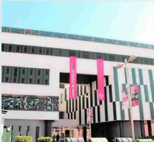
Escuela Municipal de Música y Artes de Almería, que será subse de uno de los cursos.