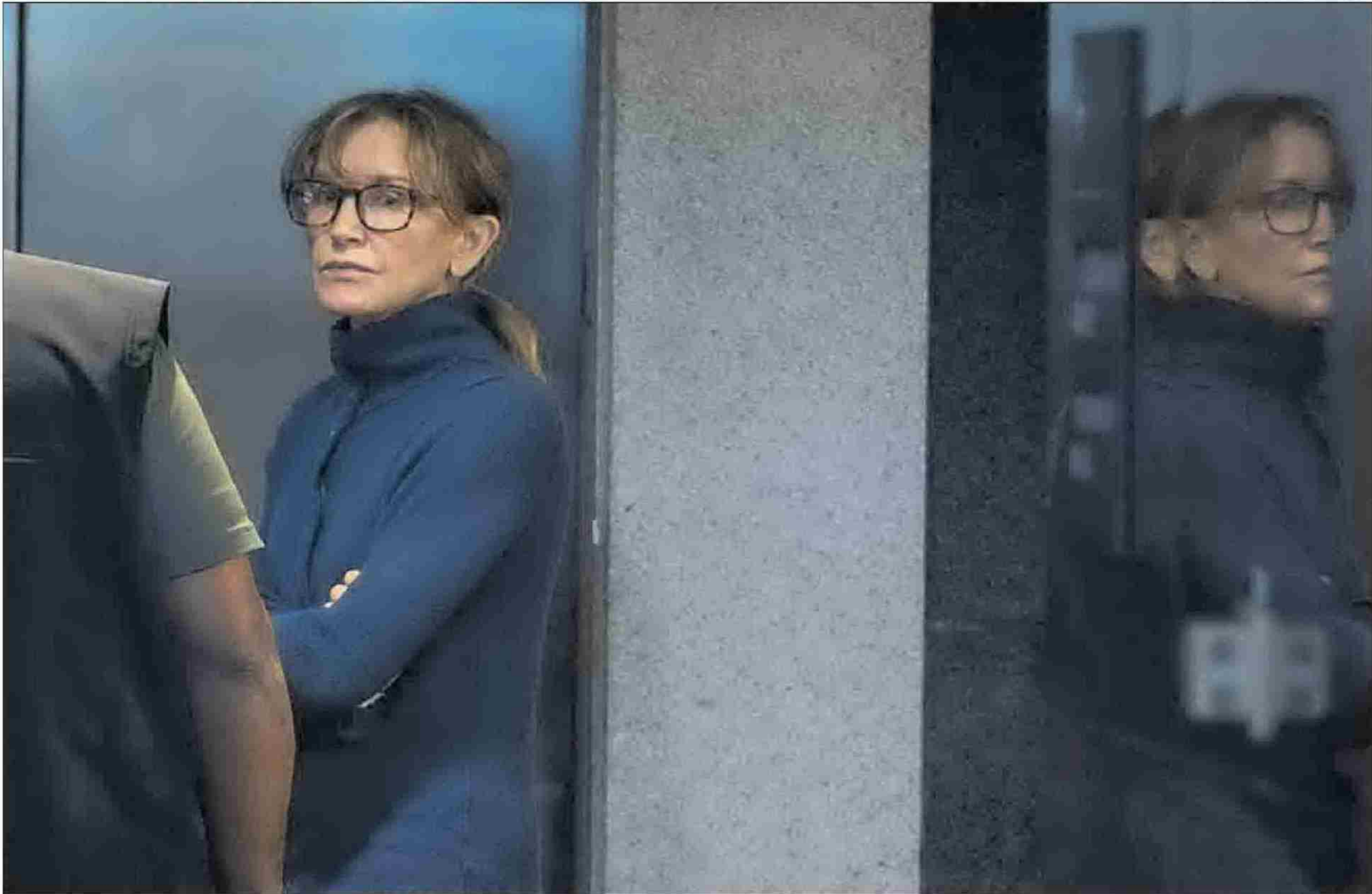
►► La actriz Felicity Huffman espera para declarar ante el juez en Los Ángeles.