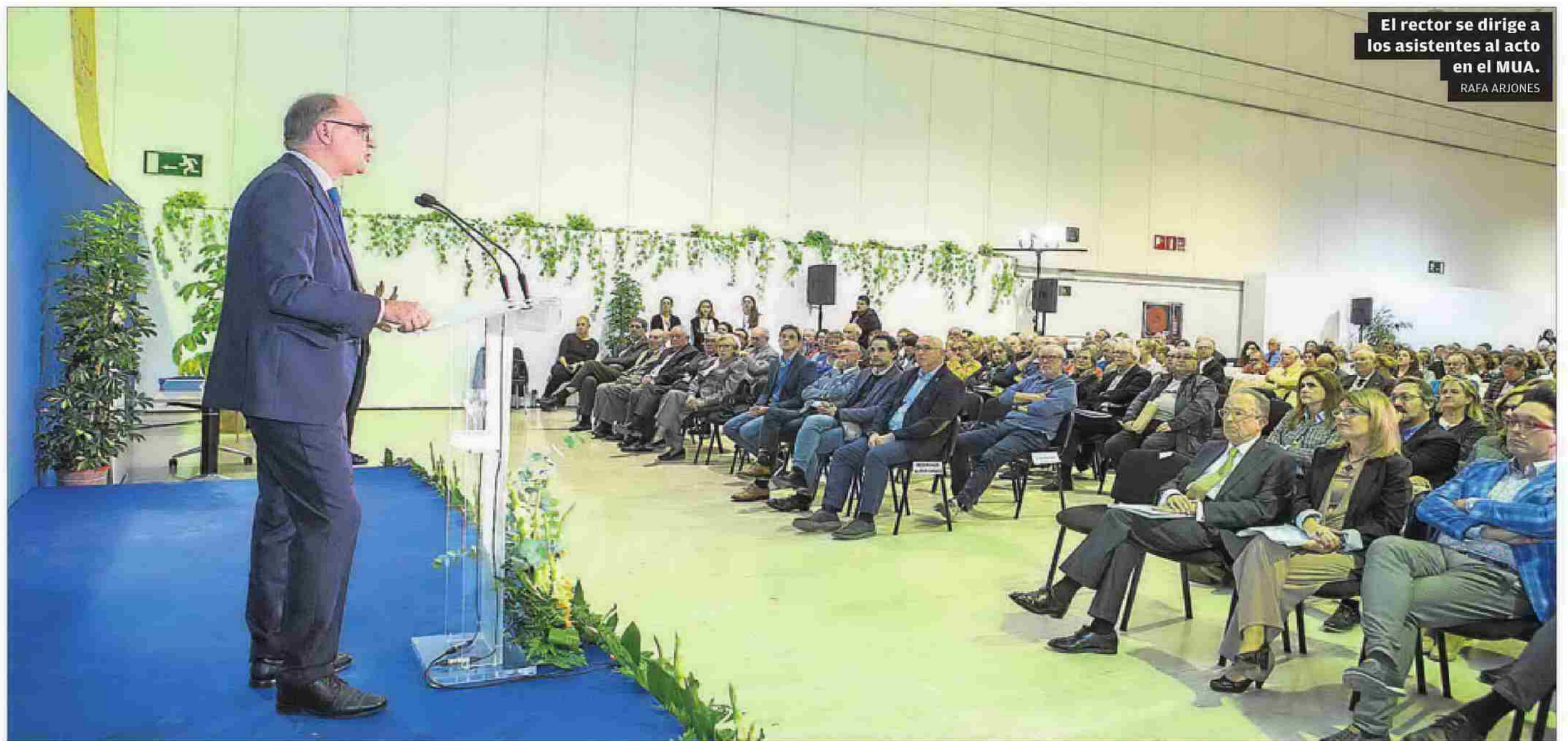
El rector se dirige a los asistentes al acto en el MUA.