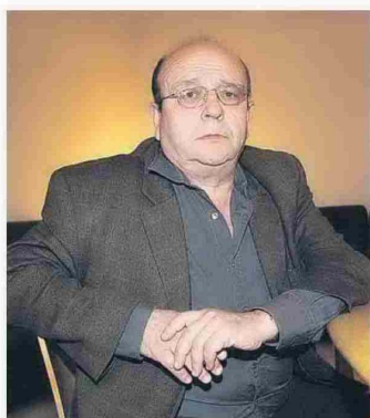
► Vázquez Montalbán, un 'enamorado' de Morella.

Tanto Posteguillo como Sierra y Giménez-Bartlett han participado en conferencias y tertulias literarias no solamente de Castellón capital, como las que organiza la Fundació Caixa Castelló, entre otras, sino también de otros pueblos, dejando de manifiesto su aprecio hacia estas tierras que conocen en profundidad.