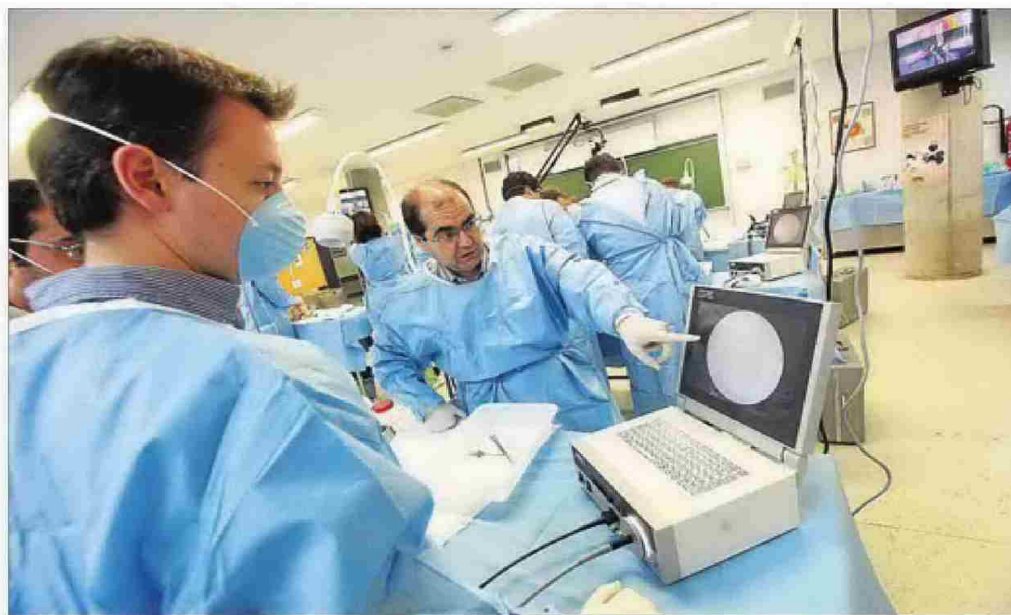
Alumnos de la UMH realizando prácticas de Medicina. ANTONIO AMORÓS

Más allá del conflicto con las prácticas, la UMH ha formado un frente común con las facultades de Medicina de las universidades de València, Rei Jaume I de Castellón, con la Conferencia Nacional de Decanos de las Facultades de Medicina Españolas y con el Consejo Estatal de Estudiantes de Medicina. Todos ellos se oponen a la apertura de nuevas facultades de Medicina al considerar que no hay suficientes plazas MIR para los estudiantes que acaban sus estudios -calculan que 500 al año se quedan sin plaza-, que conllevaría una pérdida de calidad en la docencia y la masificación en las prácticas, que colisiona con los derechos del paciente y supondrá