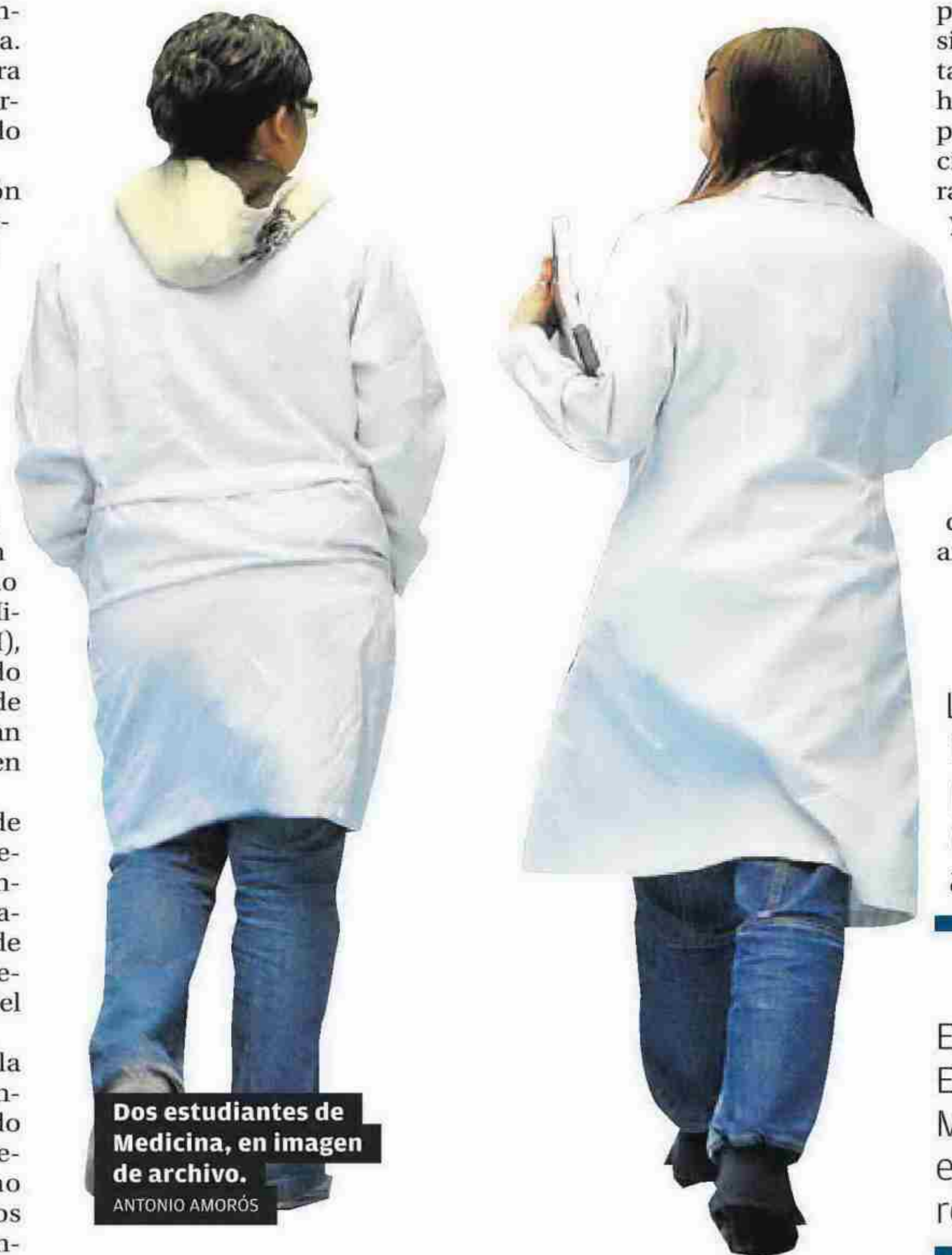
Dos estudiantes de Medicina, en imagen de archivo.

La UA negoció con el Hospital Universitario del Vinalopó de Elche, el Hospital Universitario de Torrevieja, la Clínica HLA Vista Hermosa y el Hospital QuirónSalud, es decir, dos privados y dos públicos de gestión privada. Son suficientes para la Aneca, pero la UA seguirá negociando con Sanidad, ahora con el peso que da la autorización, para conseguir también plazas en el Hospital General de Alicante y en el Hospital de La Vila, aunque este último debería ser acreditado primero como universitario. Y son precisamente las plazas en el Hospital General de Alicante las que entrarían en conflicto con la UMH, donde aseguran que un mismo hospital no puede conveniar pla-