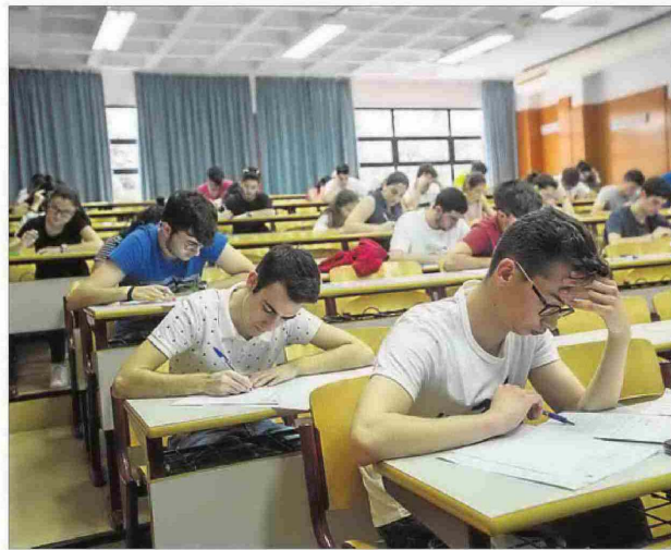
Estudiantes de la provincia en las pruebas de selectividad. PILAR CORTÉS

Tras la preinscripción universitaria, hasta el viernes 6 de julio a las 14 horas, que también deben cumplimentar los que se presentan a la selectividad en la segunda fase de repesca los días 3, 4 y 5 de julio, solo hay una convocatoria para la adjudicación de las plazas en las distintas carreras el viernes 13 de julio.