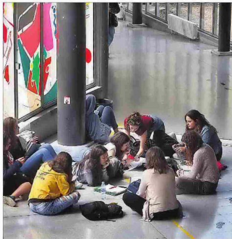
Estudiantes de la Universidad Autónoma de Barcelona.

Se han analizado 2.235 titulaciones en 73 universidades públicas y privadas