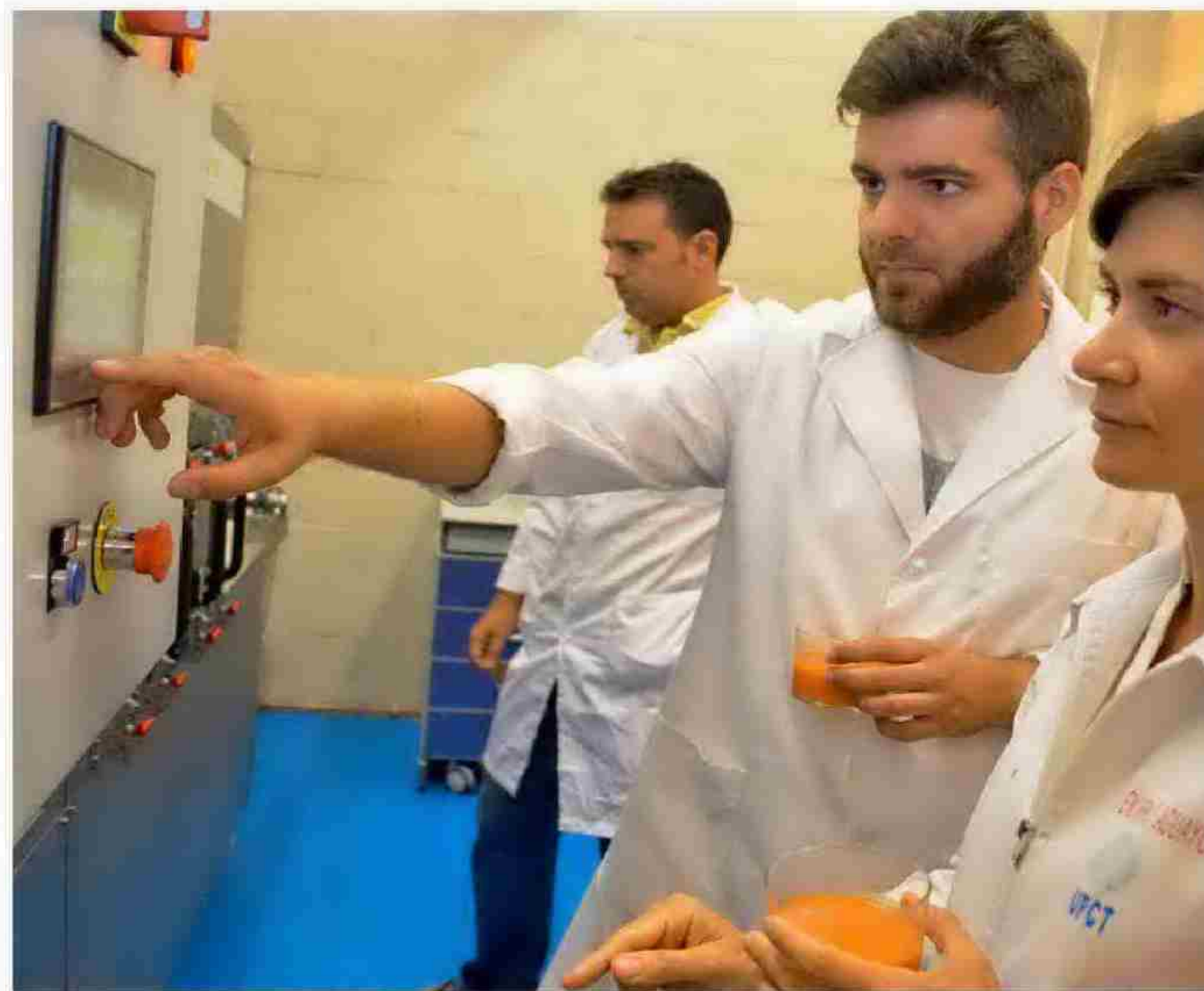
UNIVERSIDAD POLITÉCNICA DE CATALUÑA