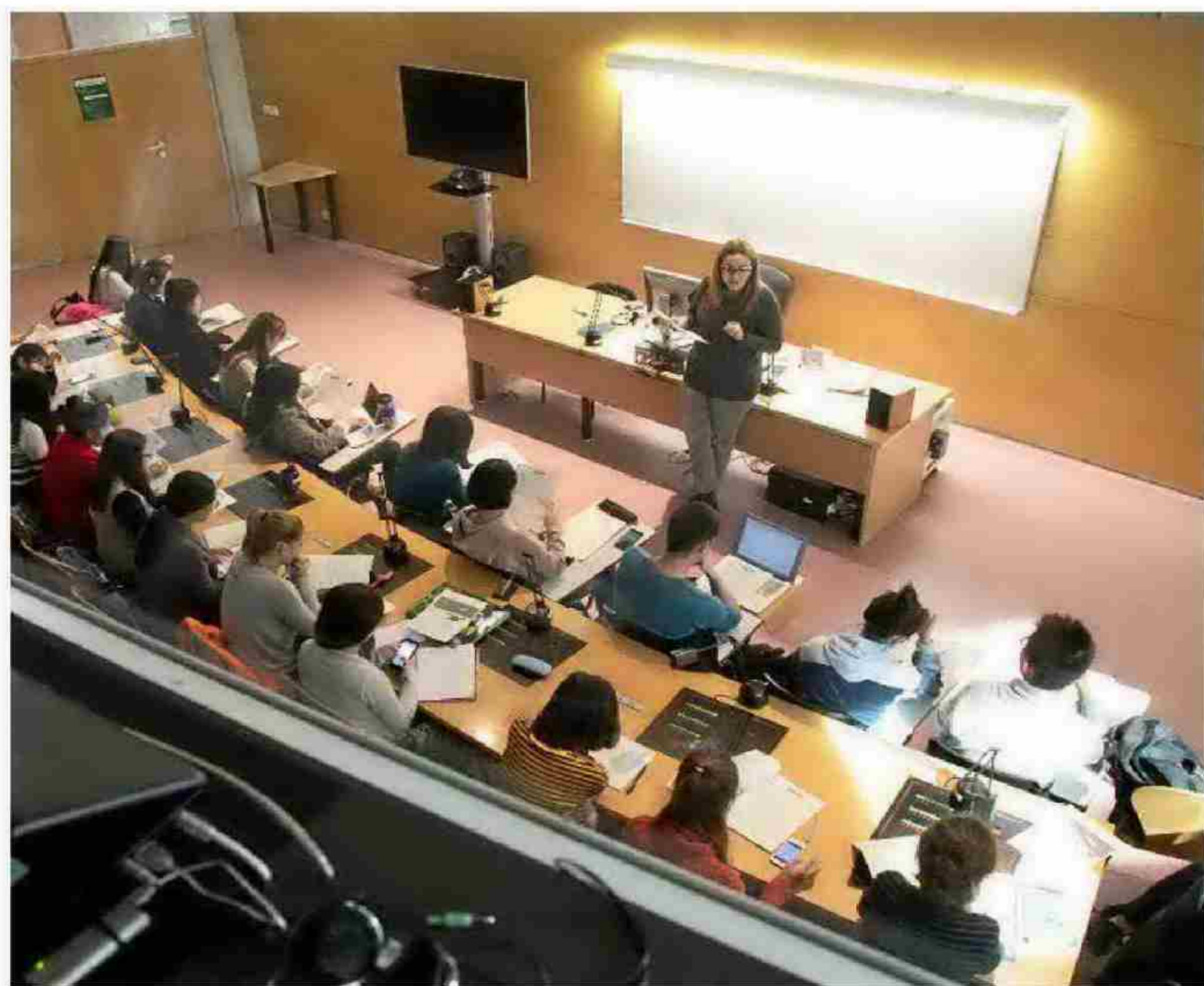
UNIVERSIDAD AUTÓNOMA DE BARCELONA