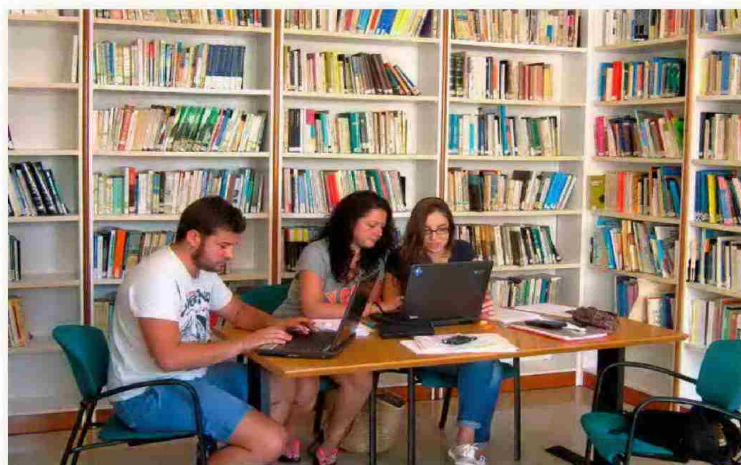
UNIVERSIDAD ISLAS BALEARES

Gracias a un convenio con la Universidad de Évora (Portugal), los estudiantes de ambas instituciones puedan obtener la doble titulación en ADE, Enfermería, Filología Hispánica, Lenguas y Literaturas Modernas (Portugués) e Historia y Patrimonio Histórico. Desde el curso pasado, imparte el grado en Criminología (en Cáceres) y el de Psicología (en Badajoz).