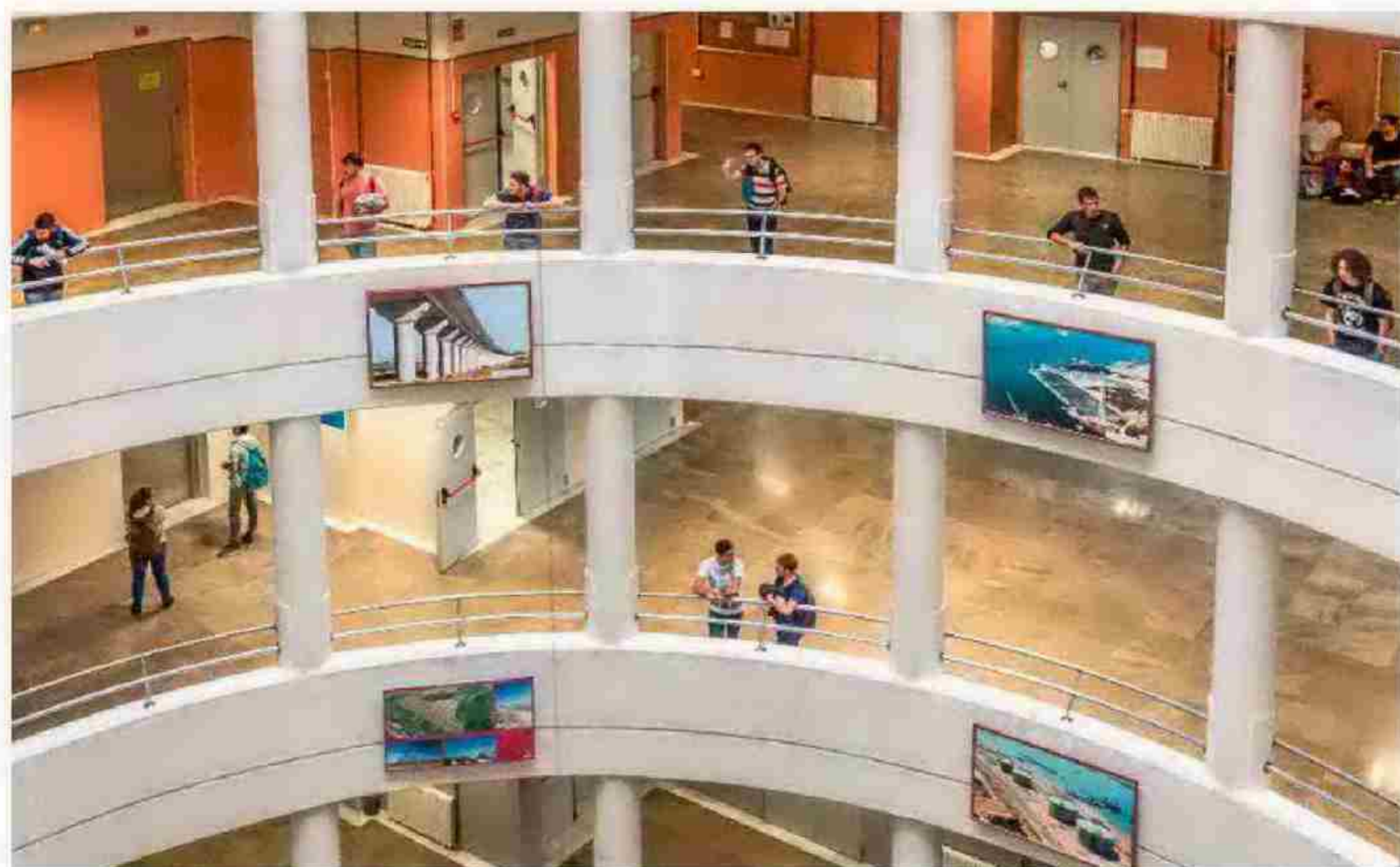
UNIVERSIDAD DE GRANADA

La UGR es el destino preferido por los estudiantes europeos para realizar un intercambio (LLP/Erasmus): el 10% de sus alumnos son internacionales. Para fomentar esta movilidad, participa en más de 800 acuerdos de intercambios bilaterales y multilaterales con instituciones de educación superior de todo el mundo. PUESTO EN EL RÁNKING GENERAL: 11º