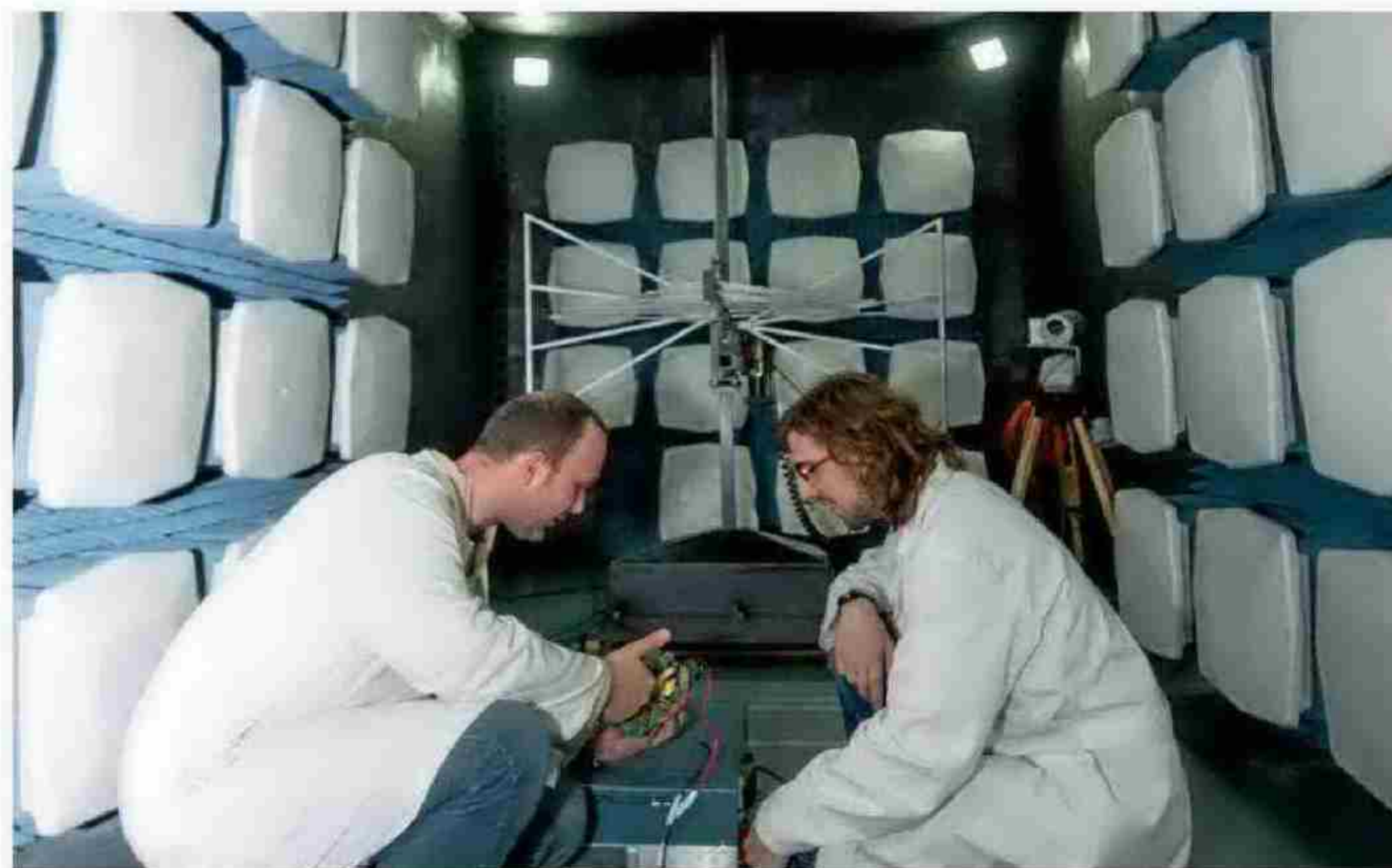
UNIVERSIDAD DE ALCALÁ DE HENARES

En el próximo curso académico, la Universidad de Lérida presentará tres nuevos grados: en Diseño Digital y Tecnologías Creativas, Ingeniería Química, Técnicas de Interacción Digital y de Computación. Su punto fuerte es el estudio de la agroalimentación al ser referente mundial en Tecnología de los Alimentos. PUESTO EN EL RÁNKING GENERAL: 28º