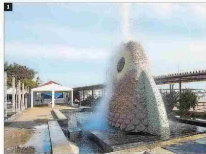
Iniciativa de la diputación y el Colegio de Arquitectos ►

La APP engloba 42 obras situadas en once municipios de Castelló; concretamente, dos en Alcalá de Xivert, tres en Betxí, dos en Borriana, 24 en la ca-