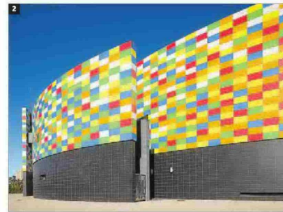
1 Escultura situada en el Moll de Costa del Grau de Castelló. © ÀNGEL SÁNCHEZ/ACF 2 La fachada del Palau de la Festa está compuesta por baldosas de diferentes colores. © ÀNGEL SÁNCHEZ/ACF

pital de la Plana, una en l'Alcora, una en Les Coves de Vinromà, dos en Onda, una en Peñíscola, una en Sant Joan de Moró, una en Vall d'Alba y cuatro en Vila-real.