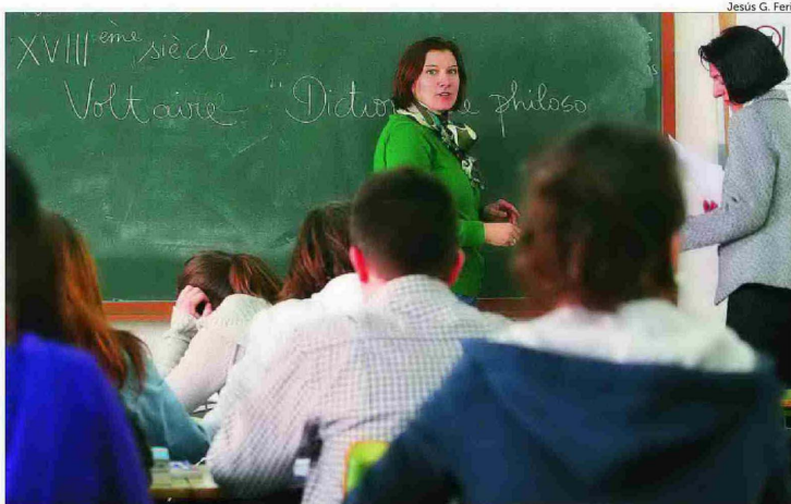
El MIR para profesores que se quiere implantar en España es similar al modelo finlandés

La mentoría también es obligatoria en la mayor parte de países