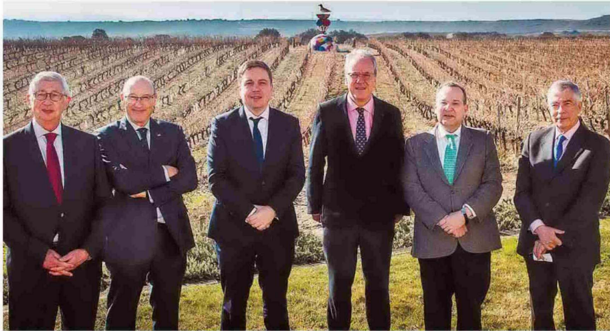
Los ponentes que participaron ayer en el debate organizado por UNIR, con el rector de este campus online y el consejero de Educación del Gobierno riojano. / NR

UNIR | DEBATE SOBRE EL PRESENTE DE LA UNIVERSIDAD EN ESPAÑA Y SUS RETOS DE FUTURO