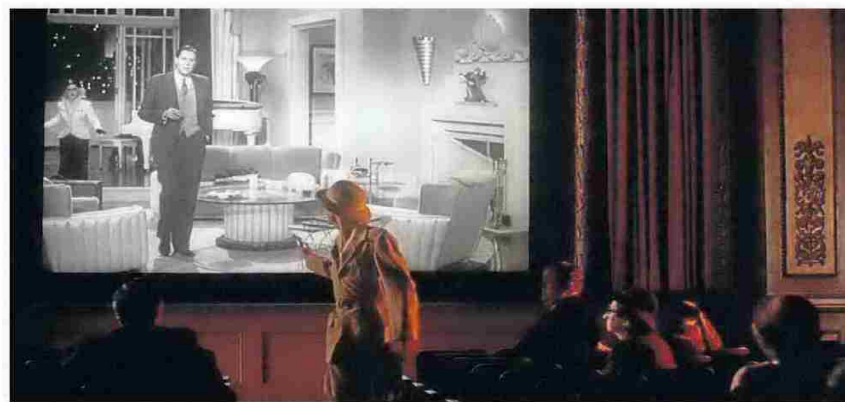
Fotogrames. Woody Allen va immortalitzar la ciutat de Nova York a 'Manhattan' -imatge de dalt-, i va reflexionar sobre la realitat i la ficció en 'Recuerdos' o 'La rosa púrpura del Cairo'.

de retrats sobre la crisi existencial que vivim tots i cadascun de nosaltres, no exempts de comicitat. Potser aquesta barreja de comèdia i profunditat filosòfica sigui el que sempre m'hagi atret d'aquest cinema tan seu, ple de diàlegs espurnejants al mateix temps que reflexius.