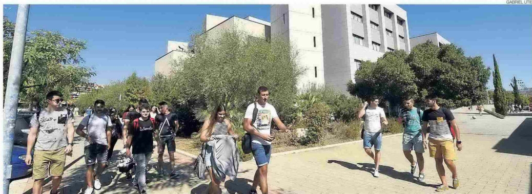
►► Estudiantado. Seis de cada 10 estudiantes de la UJI proceden de Castellón y sus comarcas, pero el otro 40% llegan al campus de Riu Sec desde toda España, según el último informe.