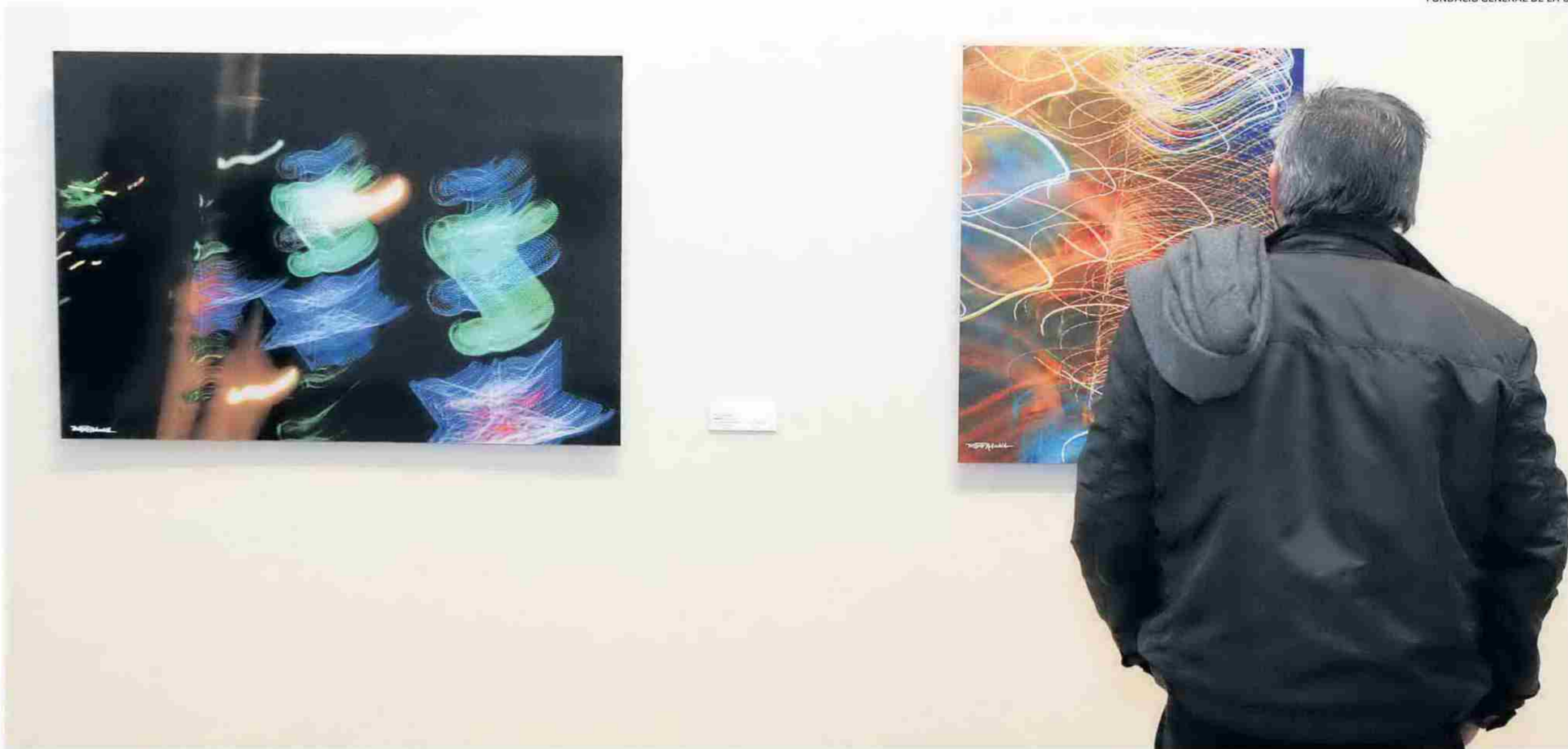
De la pintura a l'art digital. En la present mostra els visitants poden descobrir una de les facetes més desconegudes de l'artista castellonenc, com és la fotografia digital.