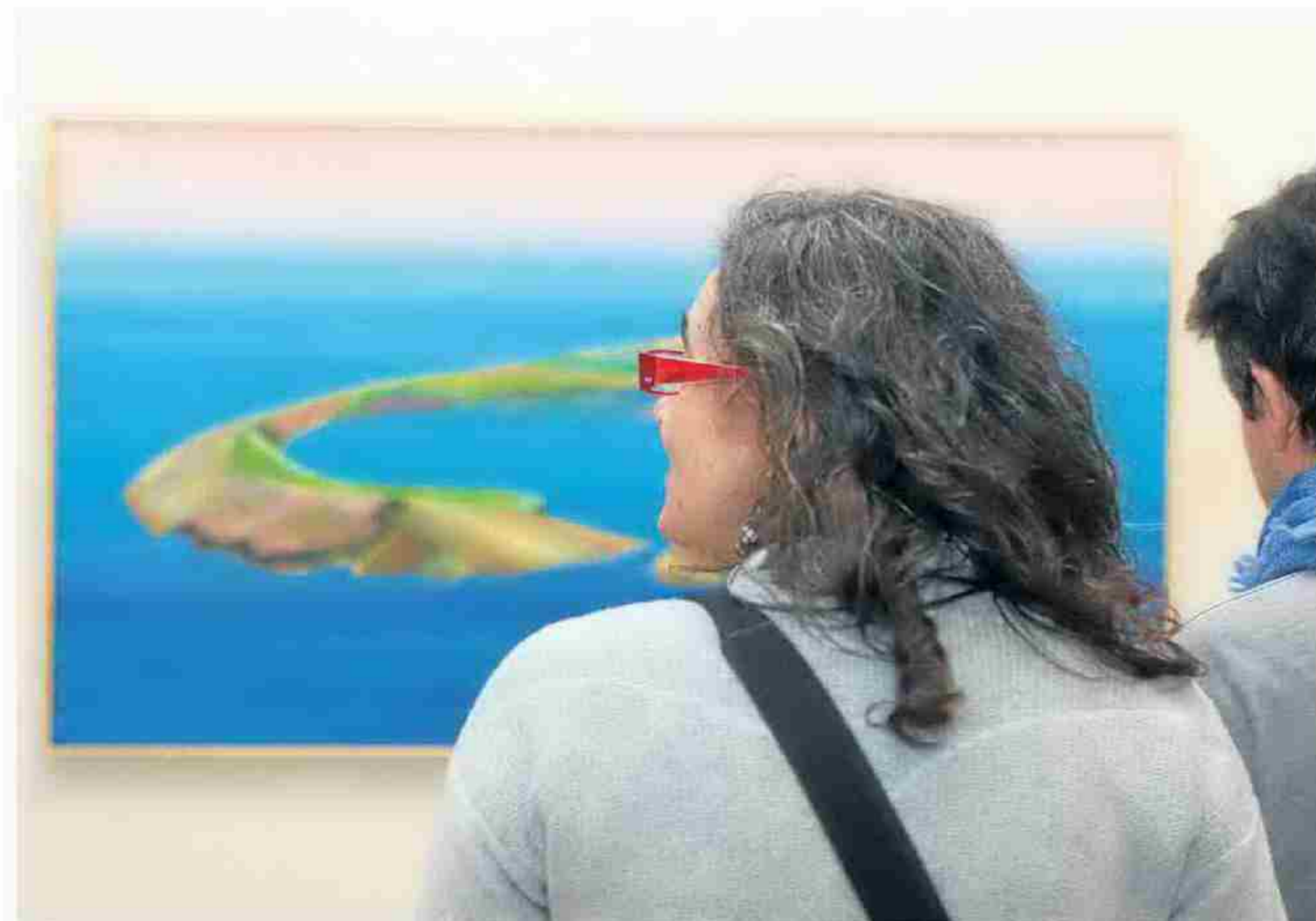
Selecció. Les obres són de diferents col·leccions privades i d'institucions públiques.