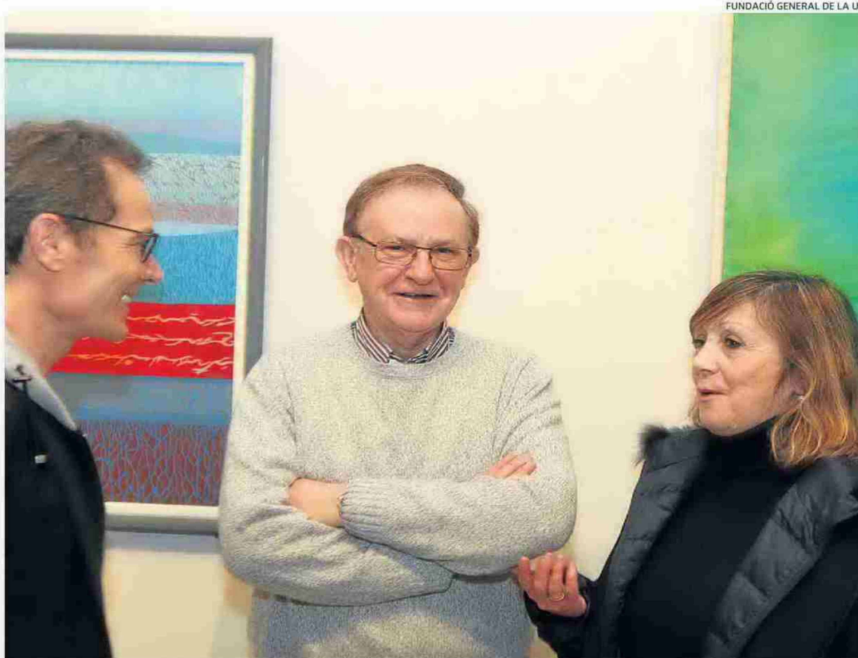
Retrospectiva. La present exposició recull una mostra de la producció artística de les últimes quatre dècades.

La Nau de València, seu de la primera retrospectiva de l'artista castellanenc