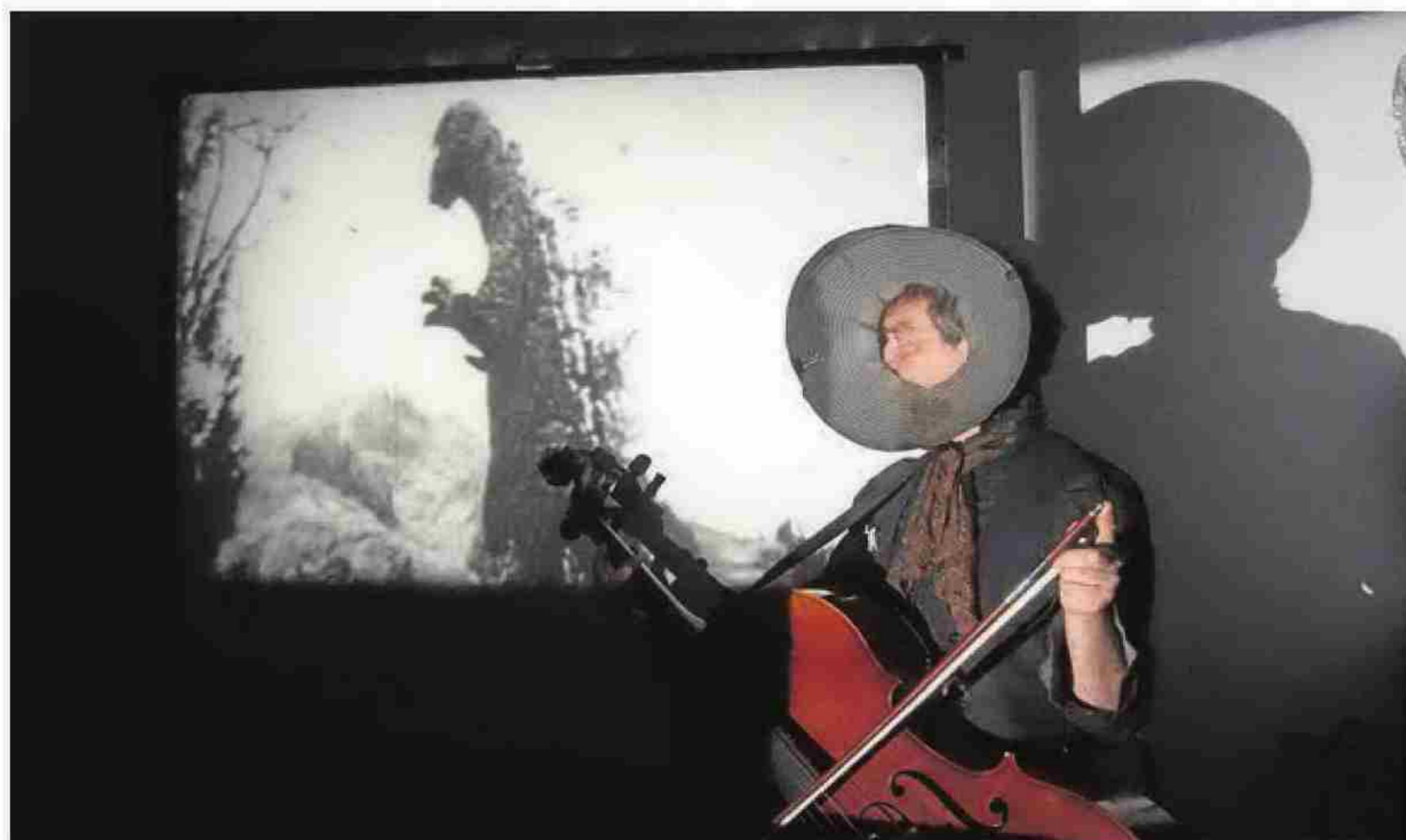
TRUNA. El músic valencià inaugurarà l'edició d'aquest any amb el film 'Freaks (La parada de los monstruos).

música del film dirigit per Masahiro Shinoda és Toru Takemitsu . És una influència persistent en el grup californià, que utilitzarà en la seua actuació diferents instruments, des gongs fins campanes, passant per percussions i altres elements electrònics.