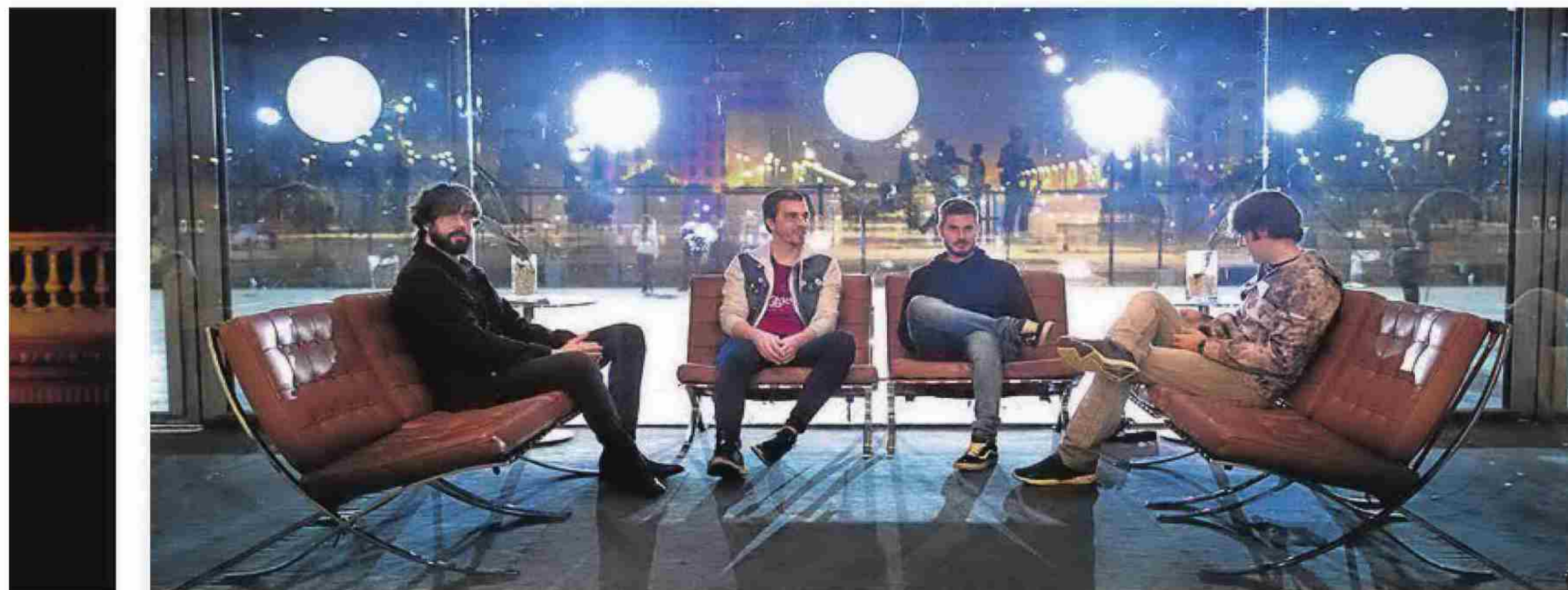
MONTEFUJI. El ara quartet castellonenc s'encarregarà de la «banda sonora» en directe de la pel·lícula 'Cube', de Vincenzo Natali.