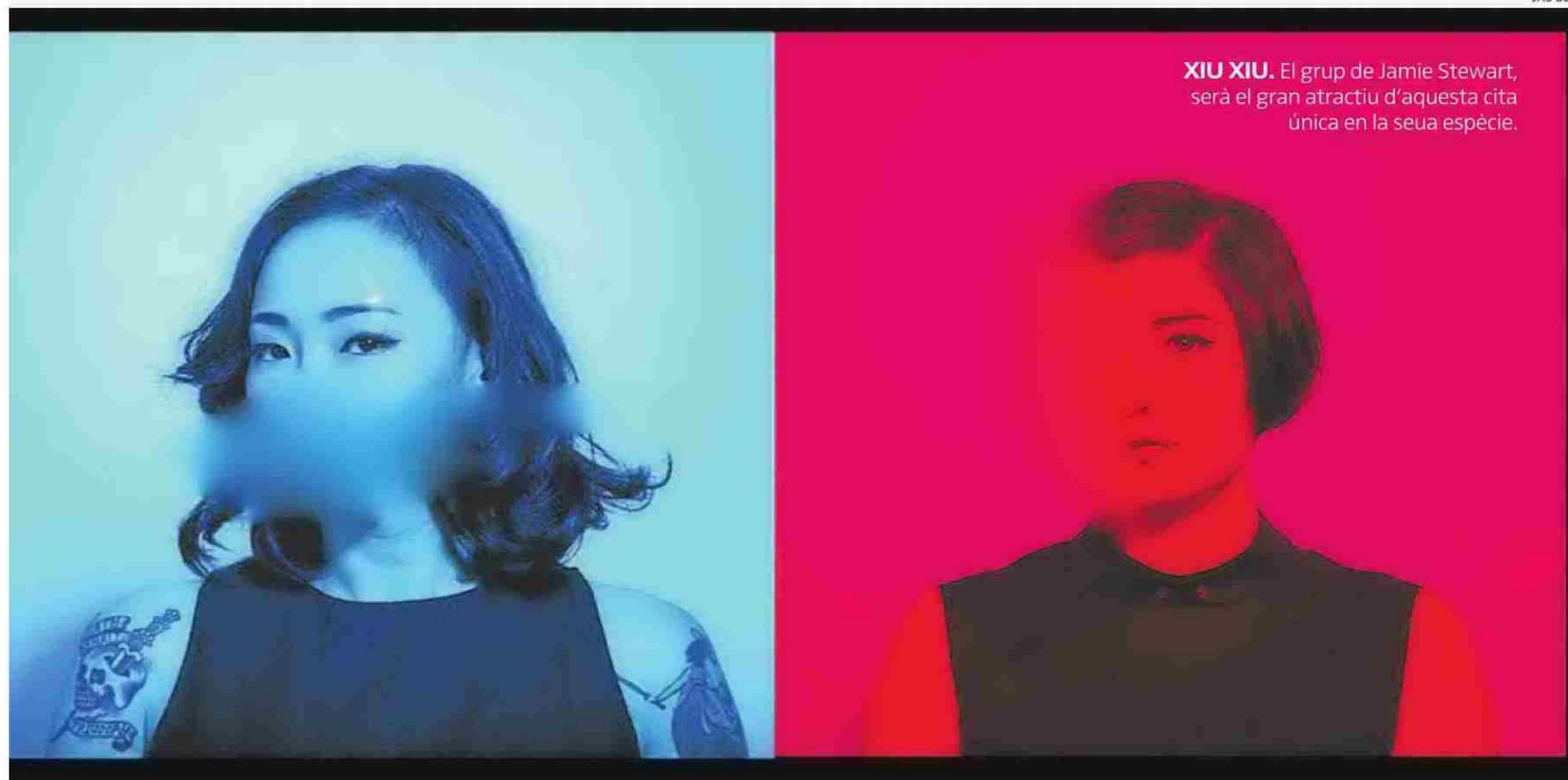
XIU XIU. El grup de Jamie Stewart, serà el gran atractiu d'aquesta cita única en la seua espècie.