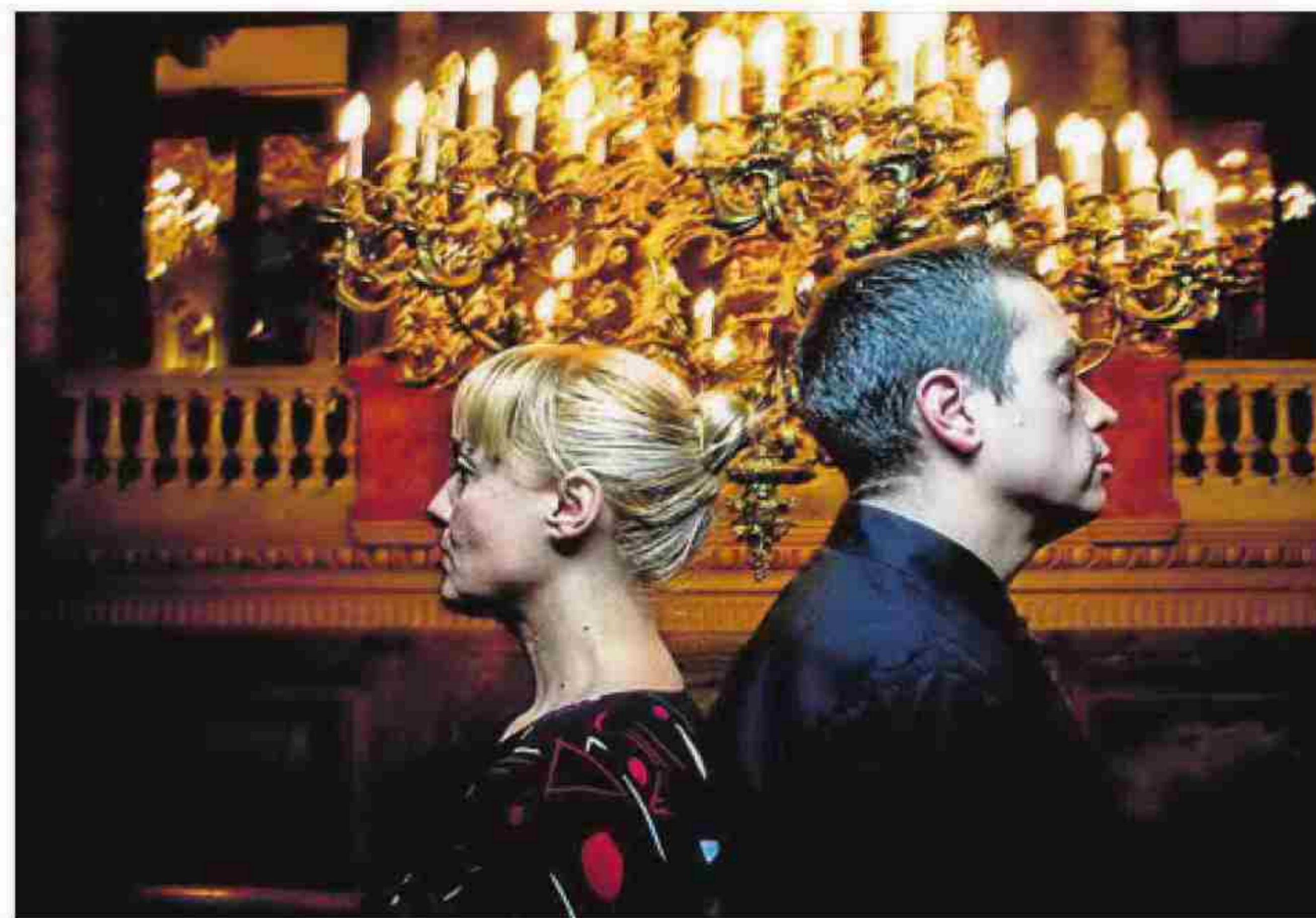
ELLE BELGA. El conjunt asturià posarà música a 'La colina', de Lumet.

d'haver dirigit Bela Lugosi en Dràcula (1931), Freaks seria una de les darreres pel·lícules que realitzés l'insomne i alcohòlic Tod Browning , qui en la seua joventut havia treballat d'acròbata i contorsionista de circ. Així, Truna tindrà la missió de crear una nova i original banda sonora durant la projecció d'un dels clàssics absoluts del cinema de terror de tots els temps.