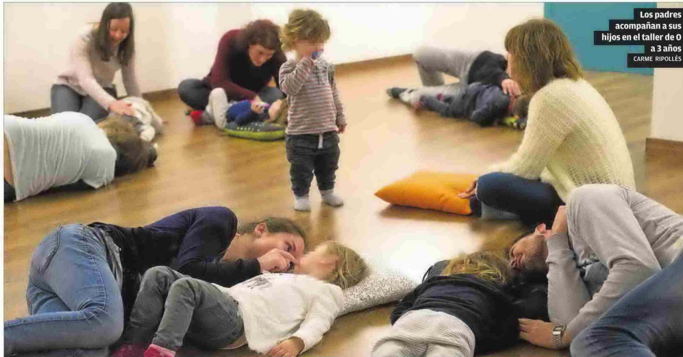
Los padres acompañan a sus hijos en el taller de 0 a 3 años