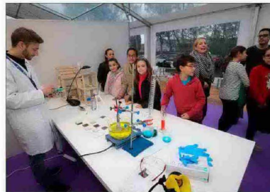
Actividades de divulgación científica con escolares.