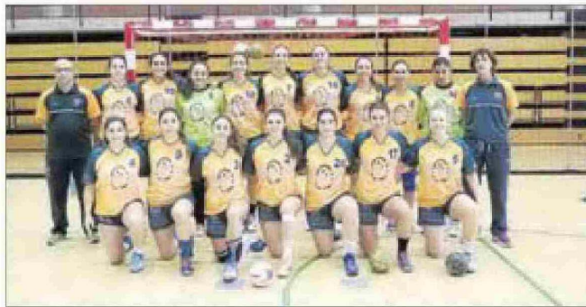
Equipo de balonmano femenino. SD

También a las 12:00 tendrá lugar el encuentro de fútbol sala masculino, que se disputará en el pabellón de deportes de la Universidad de Alicante. Para Javier Arnau el partido es «Muy complicado. Los ali-