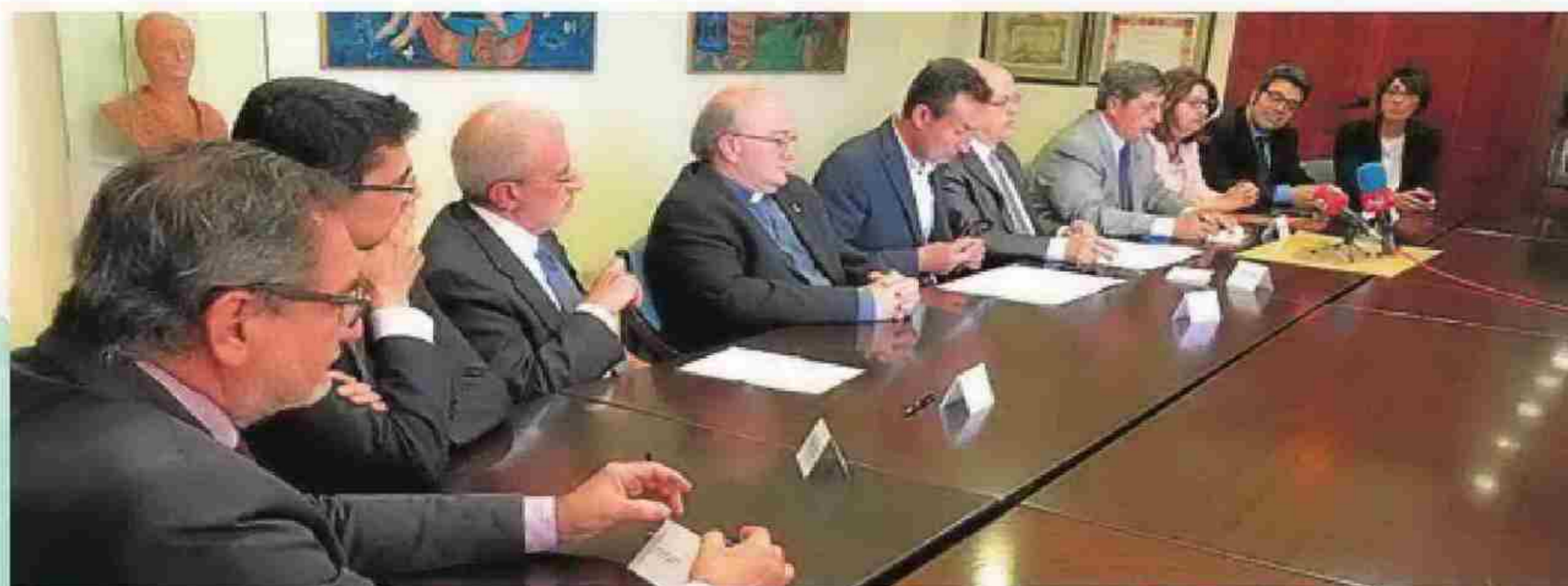
El Patronato y las Universidades Públicas Valencianas firman un convenio para la difusión y el estudio de la Festa.

«ESTE IMPULSO UNIVERSITARIO SUPONE LA PUESTA EN MARCHA DE ACTIVIDADES ACADÉMICAS, CIENTÍFICAS Y CULTURALES QUE MEJORAN LA DIVULGACIÓN E INVESTIGACIÓN DE LA FESTA»