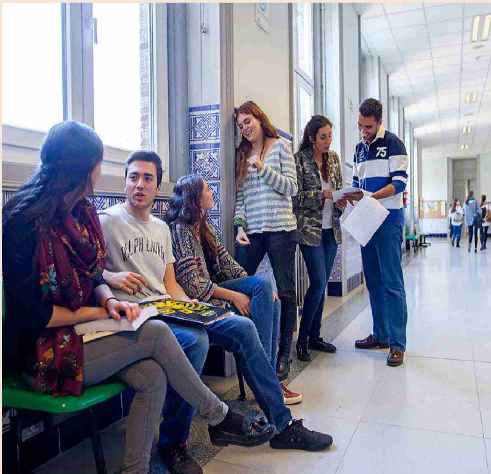
Universidad Pontificia Comillas