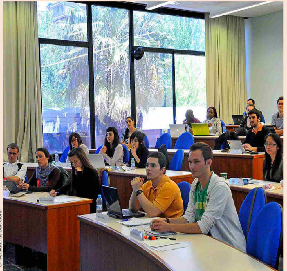
Universidad de Barcelona