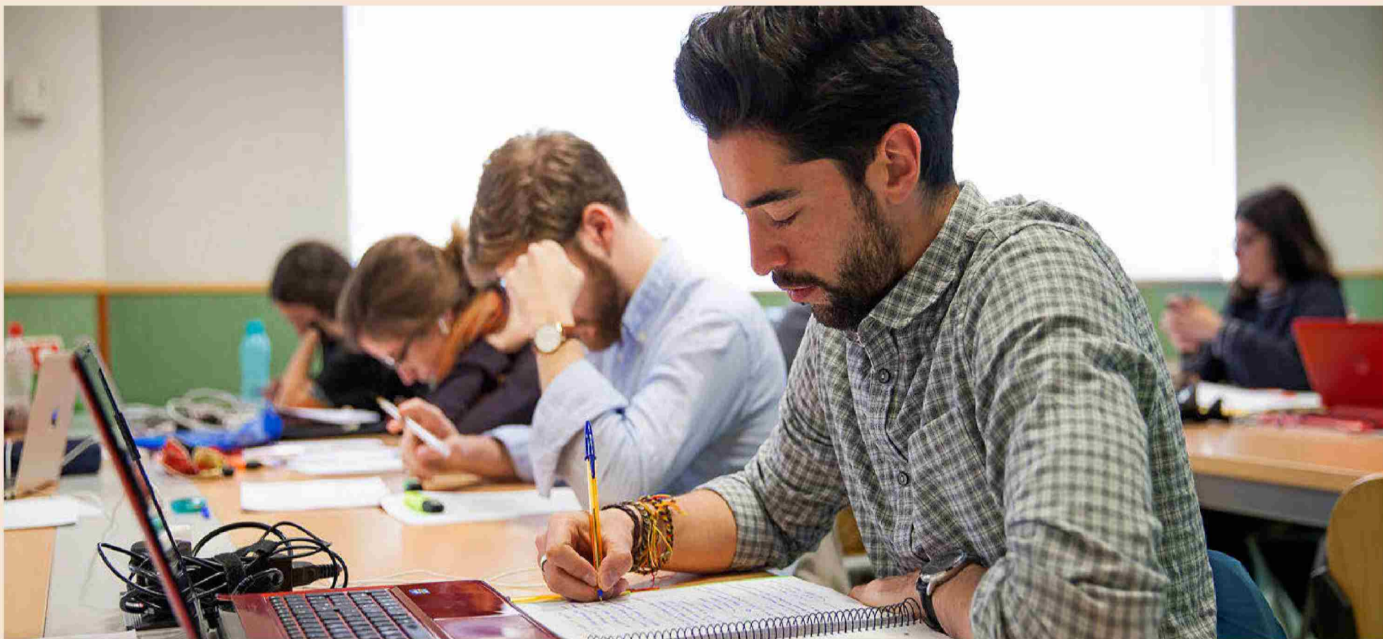
Alumnos de la Universidad Pontificia Comillas en la biblioteca del centro.