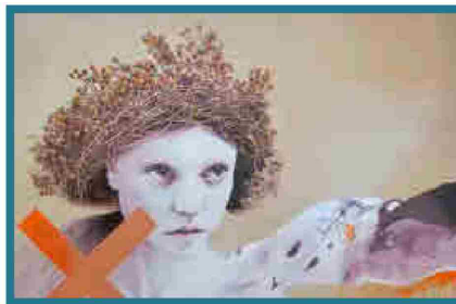
NORMA (PROTAGONISTA DE L'OPERA DE BELLINI) TÉCNICA MIXTA SOBRE TELA 87 X 130 CM