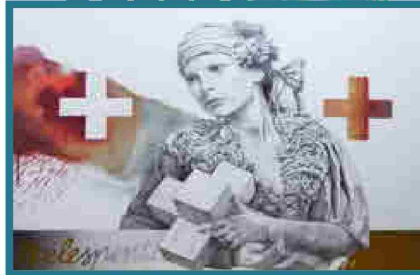
LA MIRADA DE LES SIBILLES HELESPONTICA TÉCNICA MIXTA SOBRE CARTÓN 60 X 81 CM