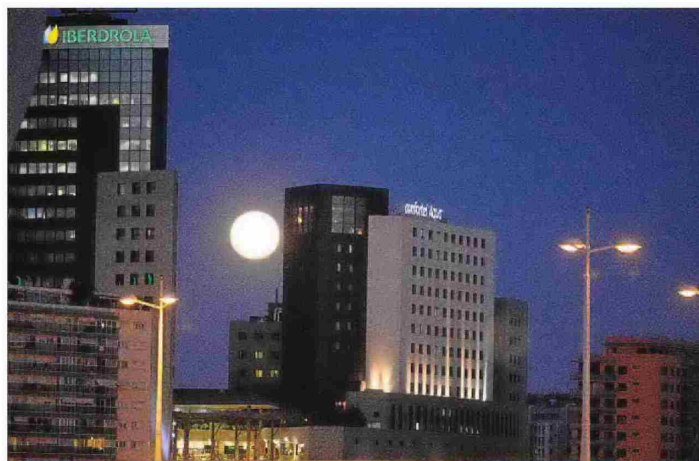
Una noche de luna llena en Valencia, en el entorno del centro comercial Aqua. PABLO GARRIGÓS

En opinión de este especialista, una iluminación correcta para una calle es aquella que permite «reconocer las caras de la gente», pero denuncia que en Valencia «en muchas vías se puede leer incluso por la noche el periódico». Otra de las cuestiones importantes unida a la sobreiluminación de la ciudad es el derecho de las personas a la intimidad. «Hay sentencias que ya han condenado a los ayuntamientos a bajar in-