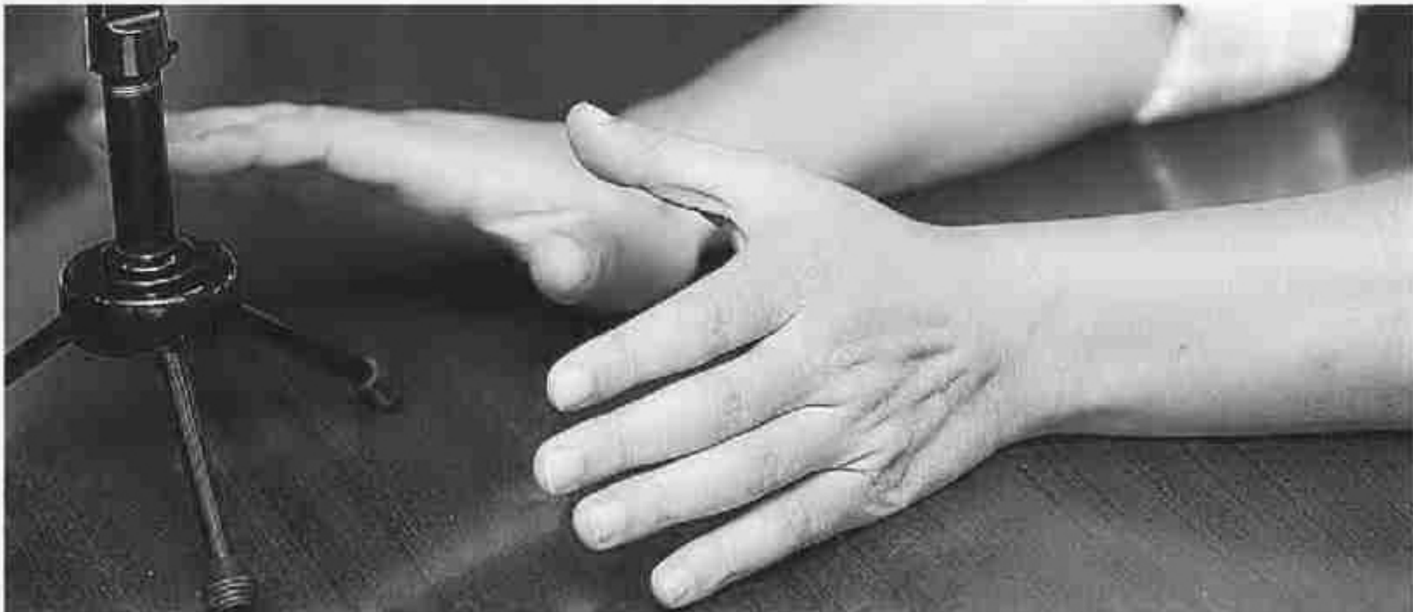
►► Evita entrar en polémicas sobre la Comunitat y els Països Catalans.

“Las universidades públicas han estado infrafinanciadas durante años y padecen una deuda inasumible. Queremos darles la máxima estabilidad”