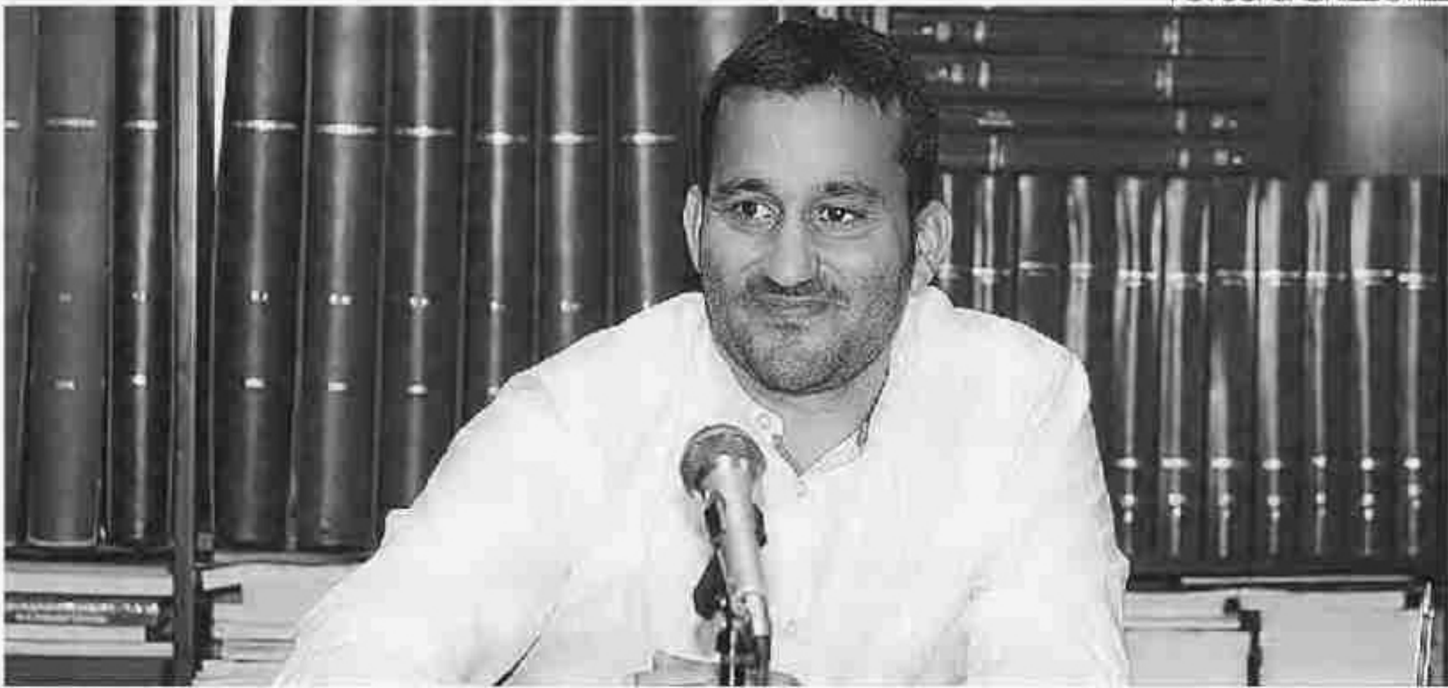
►► Marzà trabaja en un plan para facilitar el acceso a la universidad.

“Caminamos hacia una legislatura pedagógica, a dar más autonomía a los centros, y no de imposición política como hizo el anterior Gobierno”