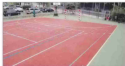
Pista deportiva del Colegio Mayor África de Ciudad Universitaria. EE