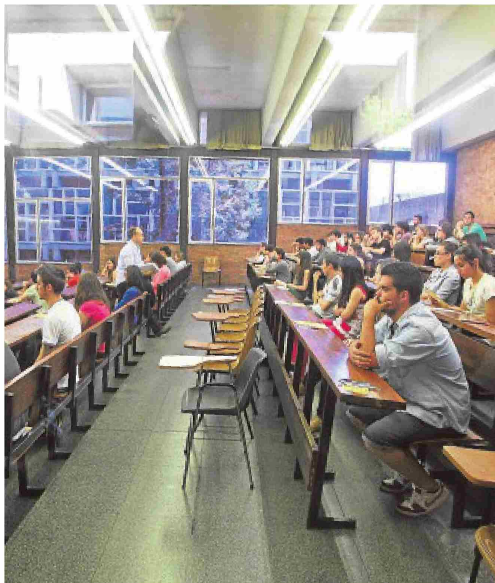
En la Universidad de Barcelona el 71% de las clases son en catalán

El peaje para este nuevo alumnado será costearse el 100% del precio del grado y del máster. En este sentido, a un joven de fuera de la UE que vaya a estudiar a Cataluña le supondrá entre 6.000 y 8.000 euros anuales formarse en el sistema público, mientras que a uno autóctono o europeo le cuesta unos 2.000 anuales de media. Esa vía directa para entrar en el sistema universitario catalán liberará a los estudiantes extracomunitarios de la Selectividad y podrán saltar directamente del Bachillerato al grado sin filtro previo.