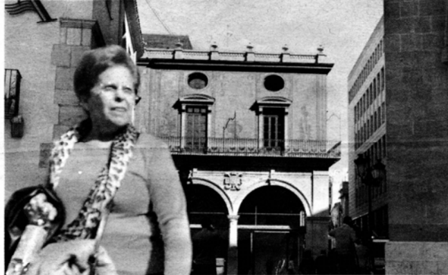
Vista desde la plaza Mayor de la remodelación de la Llotja del Cànem.