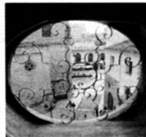
Pintura localizada en una columna (l), una pintura de la fachada (c) y una ventana del edificio. C. R.