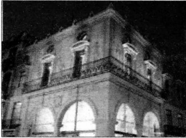
La Llotja del Cànem, ayer.

El Ayuntamiento y el Consell anuncian que cofinanciarán la rehabilitación de la Llotja del Cànem siete años después