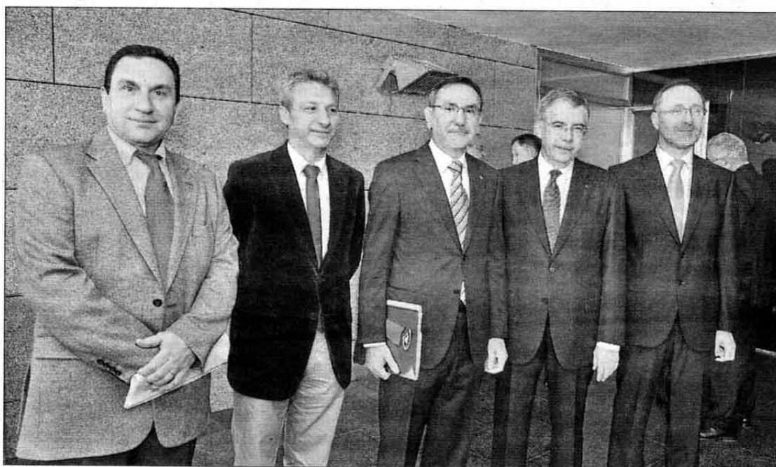
Los cinco rectores de la Jaume I se reunieron ayer para celebrar el XX aniversario. VICENT GAMIR