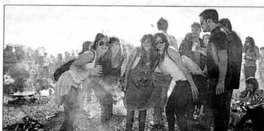
El buen humor y la música marcaron el desarrollo de la fiesta en un recinto acotado. ROBERT MUÑOZ