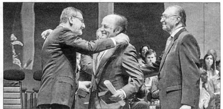
Montero y Brea recibieron la medalla de la UJI. VICENT GAMIR