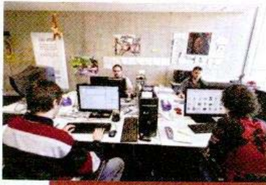
Ninja Fever está ubicada en Espaltec