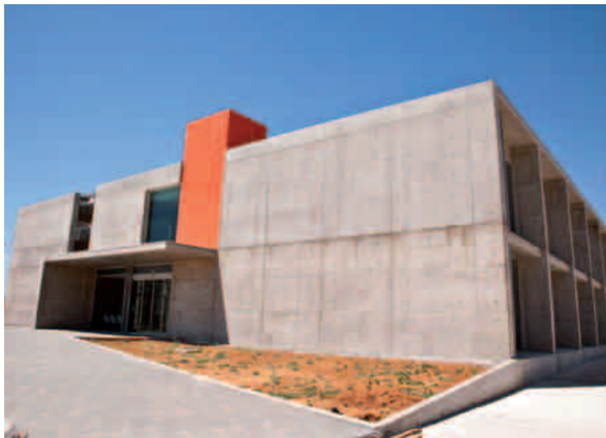
Españtec proporciona servicios de valor añadido, así como espacio e instalaciones de gran calidad