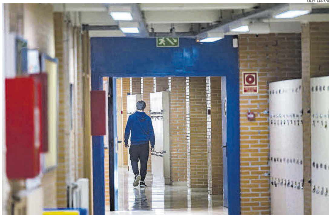
Un estudiante de Secundaria pasea por un IES en una imagen de archivo.

Entre los afectados, un 15% aseguran que no pueden dejar de preocuparse casi todos los días, un 18% dice que se irrita o enfada con mucha facilidad, un 12% tiene dificultad para relajarse y un