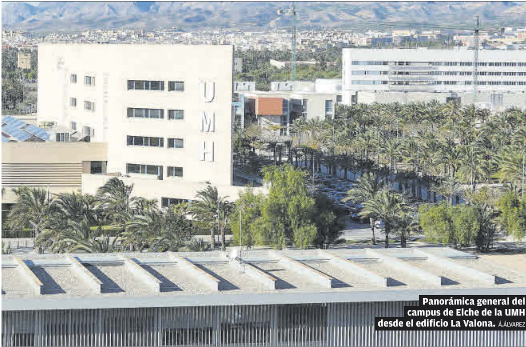
Panorámica general del campus de Elche de la UMH desde el edificio La Valona. A.ÁLVAREZ