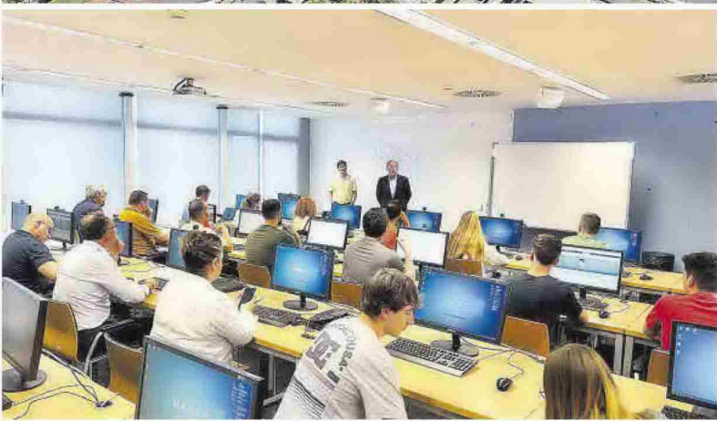
Aproximadamente 15.000 personas forman parte de la comunidad universitaria en el centro castellonense en la actualidad.