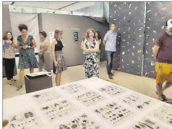
Una vista de la exposición y la rectora, en la inauguración.