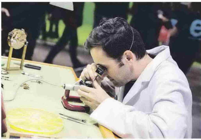
Los másters permiten acceder a un conocimiento técnico mayor y especializarse en temas en auge

Postgrado y Formación Permanente de la Universidad Francisco de Vitoria. “De igual forma, los profesionales en ejercicio deben conocer las tendencias actuales en su rama de conocimiento para no perder oportunidades de crecimiento personal y profesional”.