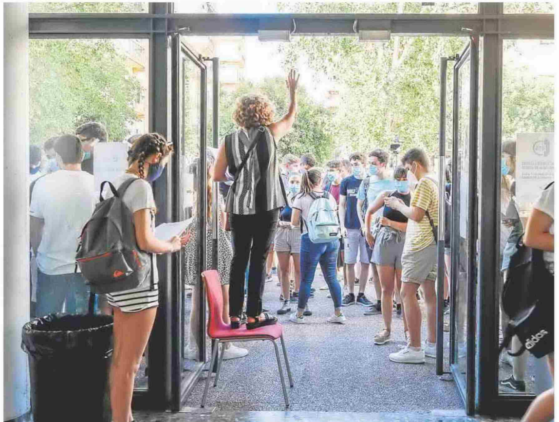
Alumnos entrando en el IES Benlliure de Valencia en 2020. La prueba se hizo en los institutos debido a la pandemia. IRENE MARSILLA

La Conselleria de Universidades publica informes anuales sobre los resultados de las pruebas de acceso a la universidad, incluyendo los de cada una de las ma-