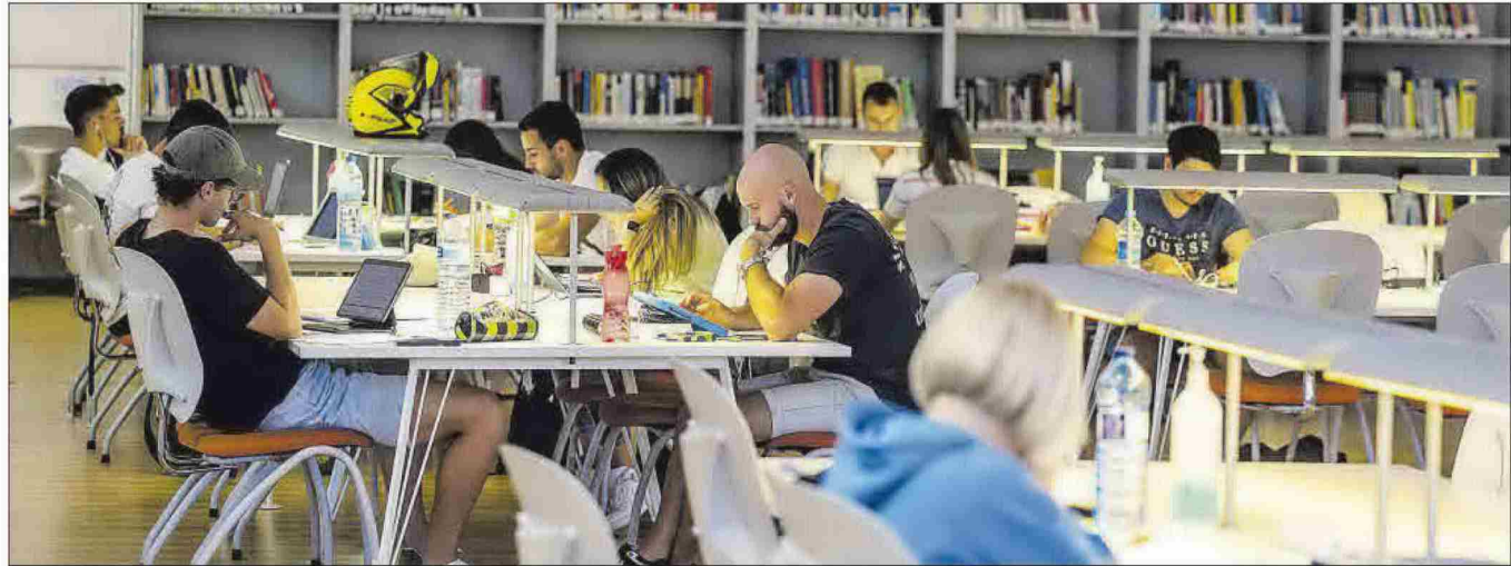
Estudiantes en la biblioteca municipal de La Nucia este lunes.