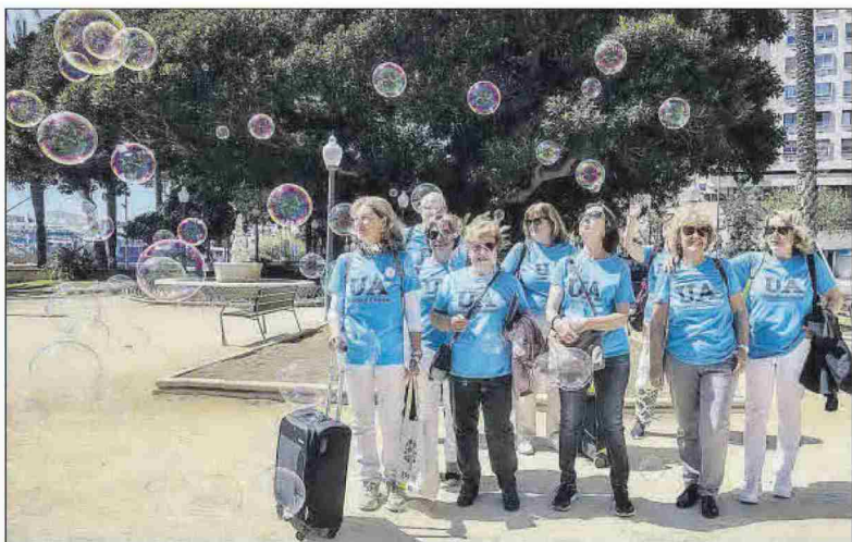
El grupo prepara las maletas para su estancia intensiva de formación en Islandia y Polonia.