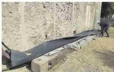
Las obras de rehabilitación de la casa de Torrecremada. Abajo, la almazara y la jácena.