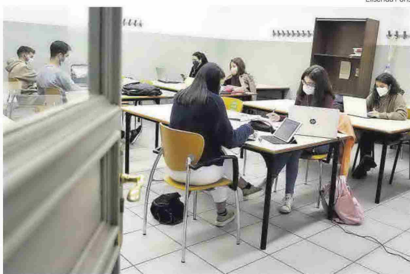
Estudiants, en una aula de la Universitat de Barcelona.

L'aclaparadora majoria dels màsters oficials (90,1%) ni habiliten ni estan vinculats a l'exercici d'una professió regulada i els preus no han sigut objecte d'acord per contenir-los. Com a resultat, un màster no habilitant pot arribar a costar més de quatre vegades i mitja més a Múrcia que a Andalusia, i arribar als 2.818 euros per curs (sense incloure-hi els màsters a preus diferenciats). Els màsters oficials a preus diferenciats, alguns dels quals són fins i tot