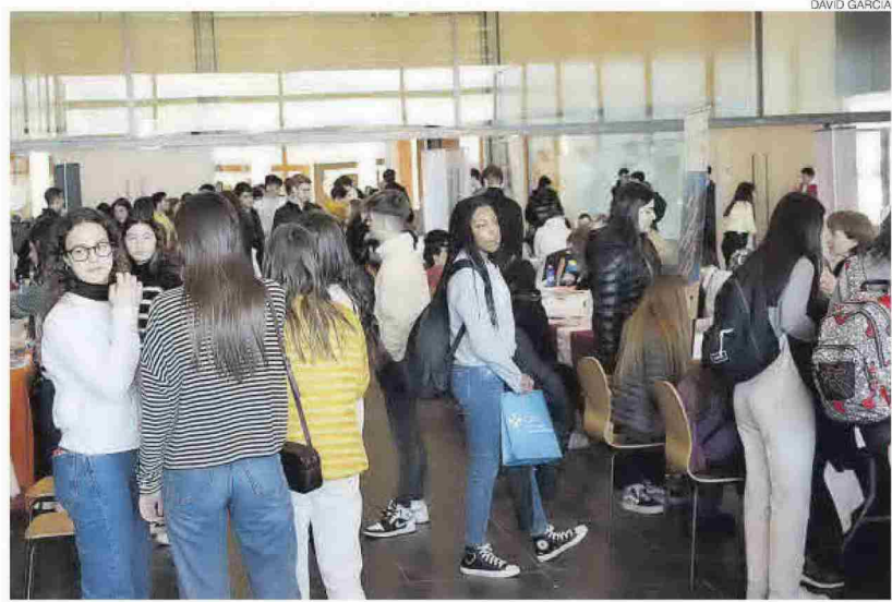
El salón de orientación universitaria Unitour se celebró ayer en el Auditori i Palau de Congressos de Castelló.

Esto es crucial porque, según el informe Datos y Cifras del Sistema Universitario Español, casi el 30% de alumnos de la Comunitat Valenciana abandona la carrera el primer año y uno de cada diez cambia de titulación. Y el 70% de ins-